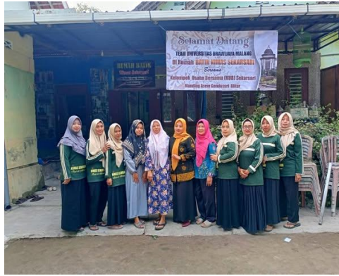
Gambar 5. Berkerjasama dengan institusi Perguruan Tinggi Negeri Universitas Brawijaya Malang sebagai personal selling atau Penjualan Personal