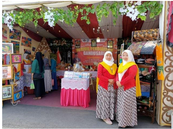
Gambar 3. Pameran/ bazar batik Nimas Sekarsari

Batik Nimas Sekarsari Gandusari Kabupaten Blitar menjual produk batik yang berasal dari Kabupaten Blitar yang sudah dikenal Masyarakat yaitu batik motif khas Kabupaten Blitar. Direct marketing Batik Nimas Sekarsari Gandusari Kabupaten Blitar dilakukan dengan menjual produk pada waktu ada kegiatan atau event-event bazar atau pameran yang diselenggarakan dinas, komunitas atau organisasi tertentu.