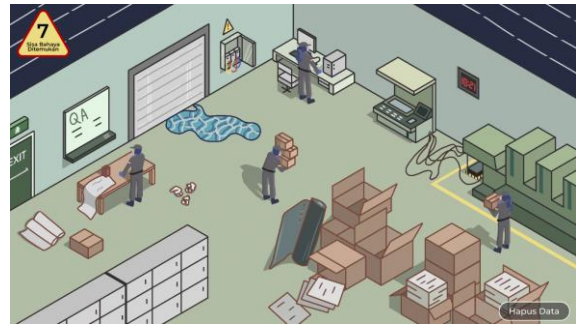
Gambar 2. Identifikasi Bahaya

Pelindung Diri) secara tepat. Setelah itu supervisor akan berkeliling memastikan tidak ada bahaya yang akan mengganggu dalam proses produksi. Dalam hal ini, supervisor harus memiliki pengetahuan yang baik akan bahaya dan jenis bahaya (Gambar 2).