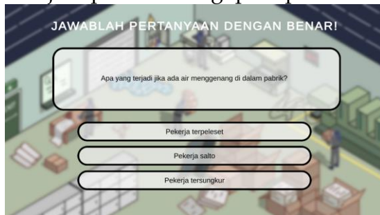
Gambar 4. Fitur pertanyaan

permainan. Pada fitur ini juga akan menjadi penilaian bagi para pemain.