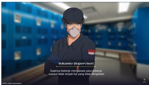
Gambar 1. Peran Supervisor

Tokoh yang ditampilkan dalam permainan ini adalah supervisor yang bekerja di industry grafika. salah satu kompetensi lulusan Teknik grafika adalah menjadi seorang supervisor. Peran supervisor adalah memastikan seluruh pekerja sehat dan selamat selama di tempat kerja. Seorang supervisor harus mampu mengidentifikasi bahaya dan menentukan risiko serta pengendalian yang dilakukan. Permainan ini diharapkan mampu memberikan gambaran secara utuh melalui ilustrasi yang ditampilkan dalam permainan.