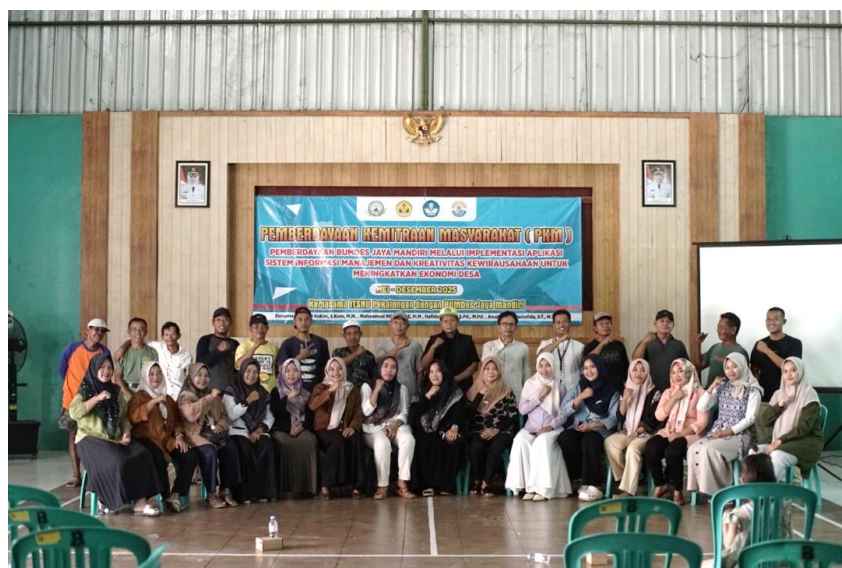
Gambar 3. Pelatihan Pengolahan Limbah Sampah

Pelatihan ini memberikan keterampilan pengolahan sampah organik yaitu pupuk kompos menggunakan tong komposter dan sampah anorganik diolah menjadi ecobrick yang dihadiri oleh 33 responden. Kegiatan pelaksanaan kegiatan pelatihan pengolahan limbah sampah dapat dilihat pada Gambar 4 berikut.