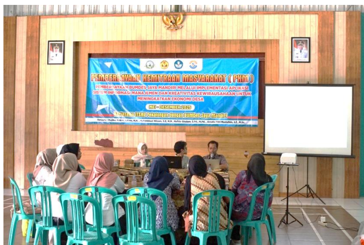
Gambar 2. Pelatihan dan Implementasi SIM BUMDes

Pelatihan ini diikuti oleh 9 responden dan bertujuan untuk meningkatkan kemampuan pengurus BUMDes dalam mengoperasikan aplikasi SIM yang terintegrasi dengan PAMSIMAS. Kegiatan pelaksanaan kegiatan pelatihan dan implementasi aplikasi SIM BUMDes ditunjukkan pada Gambar 2.