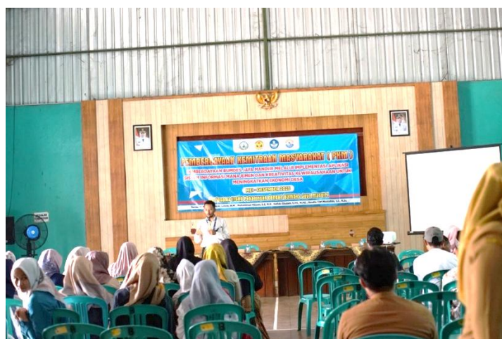
Gambar 3. Pelatihan Pemasaran Digital

Pelatihan diikuti oleh 27 responden dan difokuskan pada strategi promosi digital melalui TikTok, Instagram, Facebook, dan WhatsApp Business. Kegiatan pelaksanaan kegiatan pelatihan pemasaran digital dapat dilihat pada Gambar 3.