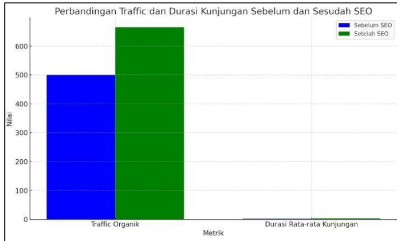
Gambar 2. Diagram Perbandingan Traffic Sebelum dan Sesudah Implementasi SEO