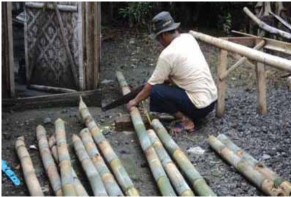
Gambar 3. Pelaksanaan Pembuatan Wadah Tanam Bambu oleh Warga

Setelah dilakukan pemotongan sesuai ukuran desain bambu, maka bersama warga merakit bambu tersebut sesuai dengan desain yang telah ditentukan.