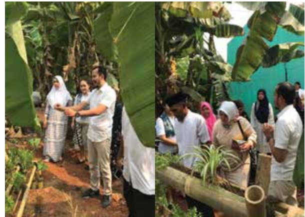
Gambar 5. Penyuluhan Terhadap Warga mengenai Apotik Hidup

Setelah ditempatkan pada lahan Apotik hidup dan ditanami dengan contoh tumbuhan yang bermanfaat seperti sirih, kumis kucing, lada, cabai, dsb, warga RT 06 RW 08 Kelurahan Jatiraden, Kota Bekasi diberikan penyuluhan mengenai manfaat apotik hidup serta penggunaan media tanam bambu.