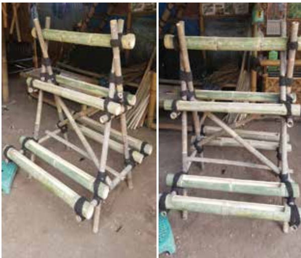
Gambar 4. Hasil Perakitan Media Tanam dari Bambu

Setelah dilakukan pemotongan sesuai ukuran desain bambu, maka bersama warga merakit bambu tersebut sesuai dengan desain yang telah ditentukan.