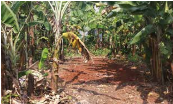
Gambar 1. Lokasi Lahan Apotik Hidup RT 06 RW 08 Kel. Jatiraden, Bekasi.