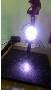
Gambar 2. Alat akuisisi citra telapak tangan

Untuk pengujian pada citra luar dilakukan pengambilan citra pada 10 responden yang masing – masing diambil 2 citra sehingga total adalah 20 citra. Telapak tangan yang digunakan adalah telapak tangan kiri.