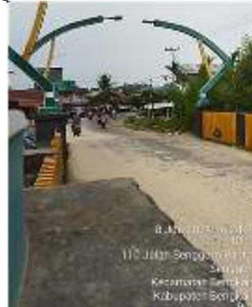
Gambar 3 Railing Masih Berfungsi Dengan Baik

Bersumber dari hasil pemeriksaan di lokasi pengujian, railing sudah mengalami kerusakan pada strukturnya seperti adanya part yang keropos, akan tetapi bagian yang lain masih dalam kondisi baik sehingga didapatkan nilai NK untuk railing yaitu 1 (satu) dengan kondisi rusak ringan.