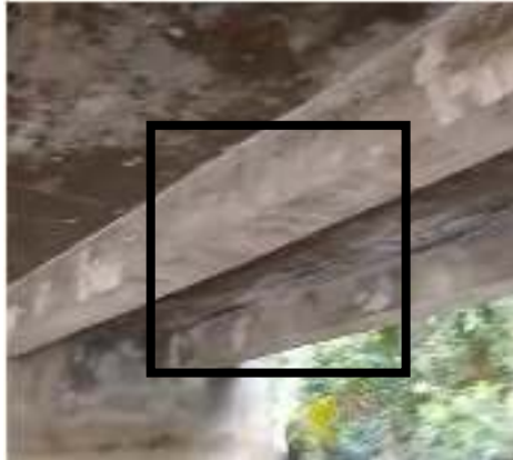
Gambar 5 Balok Masih Dalam Kondisi Baik

Bersumber dari hasil pemeriksaan di lokasi pengujian, balok sudah mengalami sedikit kerusakan pada strukturnya seperti adanya part yang terkelupas, akan tetapi bagian yang lain masih dalam kondisi baik sehingga didapatkan nilai NK untuk balok yaitu 1 (satu) dengan kondisi rusak ringan.