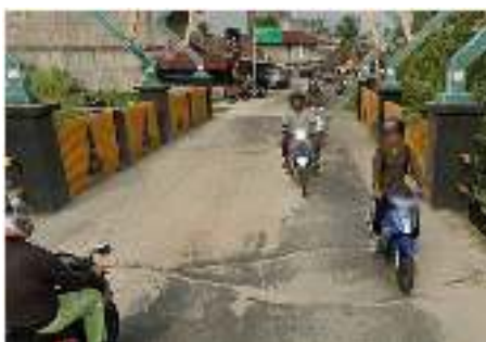
Gambar 2 Lapisan Atas Masih Dalam Kondisi Baik

Bersumber dari hasil pemeriksaan di lokasi, lapisan atas perkerasan sudah mengalami kerusakan pada strukturnya, akan tetapi bagian yang lain masih dalam kondisi baik sehingga didapatkan nilai NK untuk lapisan atas yaitu 1 (satu) dengan kondisi rusak ringan.