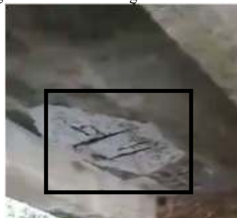
Gambar 4 Selimut Beton Slab Sudah Mulai Terkelupas

Bersumber dari hasil pemeriksaan dan tabel 6 slab jembatan di indikasikan mengalami kerusakan pada strukturnya dapat dilihat adanya bagian beton yang sudah terkelupas sehingga menyebabkan munculnya tulangan, namun masih bisa berfungsi, sehingga didapatkan nilai NK untuk slab yaitu 2 (dua) dengan kondisi rusak ringan.