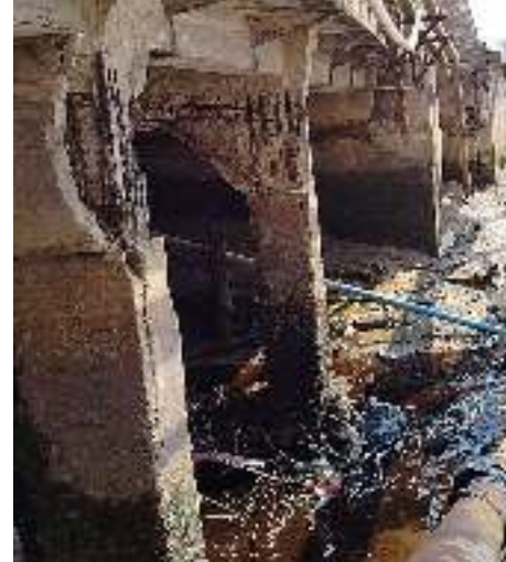
Gambar 6 Pilar Mengalami Retakan yang Parah

Bengkalis masuk kedalam jenis tingkatan kehancuran“ rusak”. Dimana dengan jenis kehancuran ini, hingga membutuhkan atensi lekas sebab mungkin besar hendak jadi sungguh- sungguh dalam waktu 12 bulan ke depan.