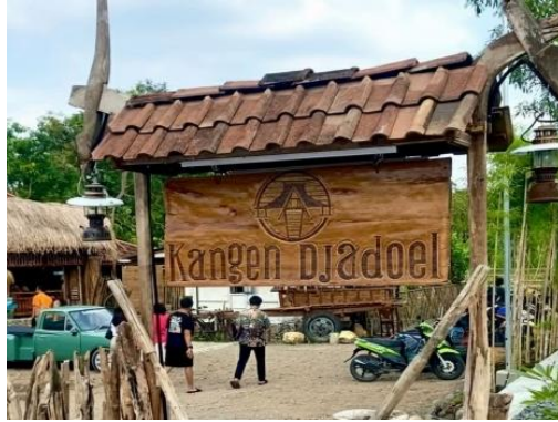
Gambar 4. Papan Nama Kangen Djadoel

adalah papan nama “Kangen Djadoel”. Analisis berikut mengkaji bagaimana pemilihan diksi dan ejaan pada papan nama tersebut berfungsi sebagai strategi semiotik yang merepresentasikan nostalgia budaya sekaligus membangun identitas usaha di ruang publik.