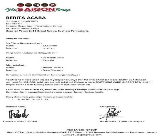
Gambar 3. Surat Berita Acara

Sebagai bagian dari kajian penggunaan bahasa Indonesia dalam dokumen administrasi, analisis berikut difokuskan pada sebuah surat berita acara yang digunakan dalam konteks perkantoran. Berita acara merupakan dokumen resmi yang memiliki fungsi penting sebagai bukti tertulis suatu peristiwa atau tindakan administratif, sehingga penulisannya dituntut untuk mematuhi kaidah bahasa Indonesia baku secara konsisten. Oleh karena itu, penggunaan ejaan, kapitalisasi, diksi, serta istilah yang tepat menjadi aspek krusial dalam menjaga kejelasan informasi dan kredibilitas institusi. Analisis terhadap Berita Acara Salah Tutup Struk yang ditampilkan pada Gambar 3 bertujuan untuk mengidentifikasi bentuk-bentuk penyimpangan kebahasaan yang masih muncul, sekaligus menilai tingkat kepatuhan dokumen tersebut terhadap Pedoman Umum Ejaan Bahasa Indonesia (PUEBI) dan konvensi bahasa administrasi.