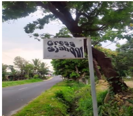
Gambar 5. Papan Nama Kedai Kopi Gress Sjahdoe

Berbeda dengan kasus pembinaan yang bersifat korektif, temuan pada papan nama UMKM justru menunjukkan adanya inovasi semiotik. Kata Sjahdoe yang diturunkan dari syahdu , dan Gress yang merupakan adaptasi leksikal Jawa, merupakan hasil kreasi linguistik yang memperkaya daya ekspresif bahasa Indonesia di ranah publik.