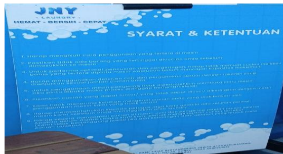
Gambar 1. Papan layanan laundry

Hasil pengamatan menunjukkan bahwasanya pelanggaran bahasa Indonesia di ruang publik tidak hanya berupa kesalahan teknis, tetapi juga mencerminkan rendahnya kesadaran terhadap penggunaan bahasa Indonesia yang sesuai kaidah. Kondisi ini tampak pada teks layanan publik, yaitu papan pengumuman layanan laundry yang menjadi objek kajian penelitian ini. Pada teks tersebut menunjukkan adanya sejumlah ketidaksesuaian dengan kaidah bahasa baku, baik aspek ejaan, pilihan kata, maupun struktur kalimat.