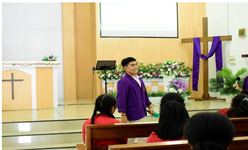
Gambar 2. Kegiatan penyuluhan NAPZA

Games tebak gambar mampu meningkatkan pemahaman, di mana metode ini sama efektifnya bahkan lebih dari audiovisual (Purnama et al., 2021). Penggunaan media game ini kendatinya dapat meningkatkan minat dan interaksi dibandingkan dengan presentasi konvensional (Kirawan et al., 2024). Game tebak gambar dilakukan sebelum kegiatan post-test dilaksanakan, di mana siswa-i di bagi menjadi tiga kelompok, kemudian tim mengeluarkan kartu berupa gambar-gambar tentang napza dan meminta siswa-i dari masing-masing kelompok untuk menebaknya. Dari kegiatan tersebut diperoleh jika, pesan yang telah dipaparkan oleh pemateri tersampaikan kepada siswa-i dengan tolak ukur semua peserta dapat menebak gambar yang diberikan oleh tim PkM. Hal ini didukung oleh hasil penelitian yang dilakukan oleh (Indah et al., 2020) di mana intervensi interaktif terbukti secara sintetik sebesar dua kali lebih efektif daripada metode ceramah dalam pencegahan perilaku berisiko pada remaja.