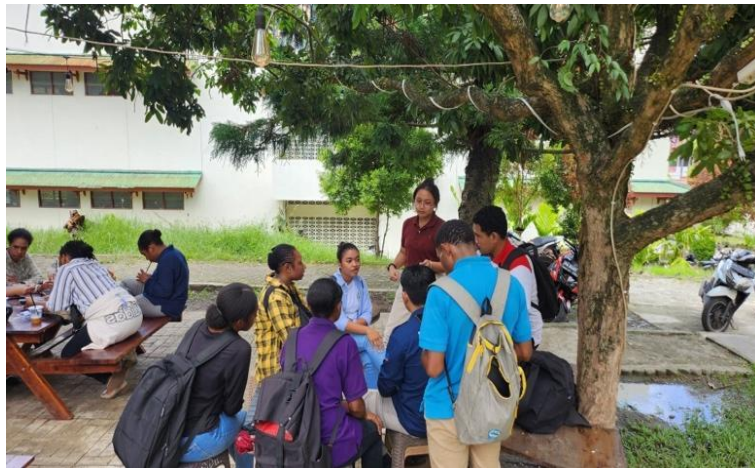
Gambar 1. Diskusi penentuan sasaran penyuluhan

Hasil diskusi yang telah dilaksanakan diperoleh sebanyak 57 orang siswa yang diperoleh dari hasil diskusi antara team PkM dengan pihak sekolah yang terdiri dari 19 orang siswa-siswikelas VII, 19 orang siswa-siswikelas VIII dan 19 orang siswa-siswikelas IX, berusia antara 12-15 tahun dengan usia peserta terbanyak yang mengikuti kegiatan ini yaitu 13 tahun sebesar 33,3% dan latar belakang suku terbanyak adalah non-Asli Papua (63%) dengan jenis kelamin siswa-siswiterbanyak yang mengikuti kegiatan PkM ini adalah perempuan sebanyak 52,6%, dimana data ini terlihat pada Tabel 1. Peserta yang terlibat dalam kegiatan PkM ini harus memenuhi kriteria berupa: siswa-siswitersebut lancar membaca dan menulis serta peserta yang diikutsertakan adalah peserta yang tidak memiliki keterbatasan fisik maupun mental.