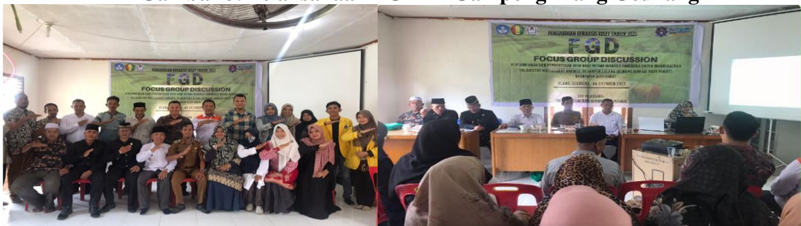
Gambar 3. Pelaksanaan FGD Di Gampong Blang Geunang

Ada beberapa hal tujuan sasaran permasalahan yang dibahas sesuai dengan Metode SMART yang dilakukan adalah sebagai berikut: (1) menguatkan Tugas dan fungsi Lembaga adat Petani dengan sesuai dengan aturan yang mengikat; (2) Mekanisme yang harus ditempuh oleh penyuluh pertanian agar hasil panen semakin tinggi; (3) Pola komunikasi yang interaktif antara petani dan penyuluh.