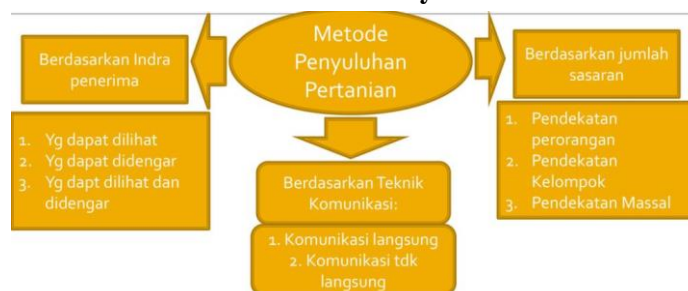
Gambar 5. Metode Penyuluh Pertanian

Mekanisme ini akan dikuatkan di gampong blang geunang melalui juknis dan kesepakatan kedua belah pihak yang telah disepakati dalam forum FGD dengan pihak terkait, agar semakin intensif sasaran pertanian yang berkelanjutan. Mekanisme pola merupakan standar dan prosedur yang wajib digunakan oleh penyuluh kepada masyarakat adat petani di gampong blang geunang pada masa yang akan datang.