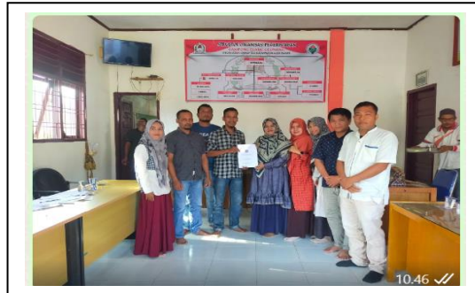
Gambar 2. Penyamaan persepsi awal tentang tujuan dan sasaran di Kantor Gampong Blang Geunang