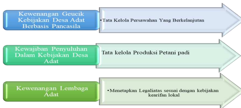
Gambar 4. tugas dan fungsi dalam tata kelola persawahan di Gampong Blang Geunang

hasil rekomendasi FGD bahwa harus ada bentuk konsolidasi waktu yang rutin dalam tata kelola persawahan antara kelompok tani dan penyuluh pertanian. Lalu, mekanisme ini akan dibentuk oleh pemerintah desa melalui persetujuan para mitra penyuluh hal yang menjadi kewajiban yang wajib dilakukan sesuai dengan hasil standar operasional prosedur dari kewajiban penyuluh sendiri. Hal ini diwujudkan agar pola komunikasi dapat terarah sesuai dengan ketentuan yang berlaku.