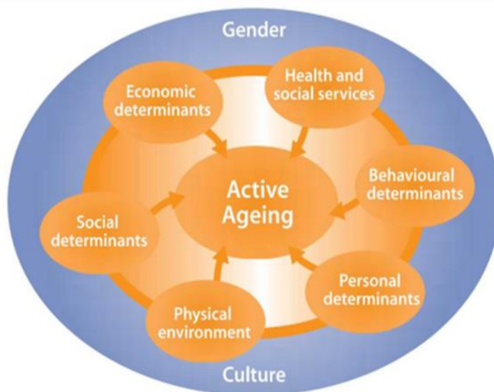
Gambar 1. Delapan Faktor Konsep Active Ageing

Anak muda harus memahami mengenai konsep active ageing , untuk mencapai konsep Active Ageing yang sesungguhnya. Mayoritas anak muda sesungguhnya memiliki perhatian khusus pada lansia, namun banyak juga dari mereka yang masih belum mengetahui mengenai hak-hak lansia seperti salah satu contohnya adalah hak dalam bekerja. Tentunya anak muda dinilai memahami dan siap menjadi lansia berdaya pada konsep active ageing apabila mereka memenuhi pengetahuan mengenai faktor-faktor dari apa yang disebut konsep active ageing .