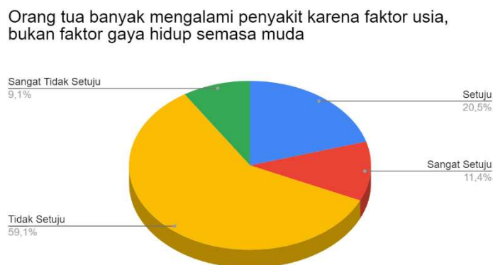
Gambar 2: Diagram Hasil Pernyataan Faktor Penyakit pada Lansia

responden yang juga mendukung pernyataan bahwa semua orang perlu untuk menjaga kesehatan sedini mungkin dan juga berolahraga secara rutin.