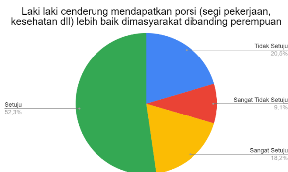
Gambar 4: Diagram Hasil Pernyataan Aspek Gender

Pada aspek gender terdapat tujuh item didalamnya. Pada item pengasuhan keluarga, responden telah memiliki kesadaran yang baik mengenai kesetaraan gender disamping adanya budaya di Indonesia. Ada 77,2% responden yang tidak setuju apabila claim bahwa perempuan lebih cocok mengasuh dari pada seorang laki-laki. Item ini juga didukung dengan 68% responden yang terdiri baik laki-laki maupun perempuan juga turut andil dalam mengasuh atau minimal mereka juga menjaga adik/keponakan atau keluarga mereka dalam kesehariannya.