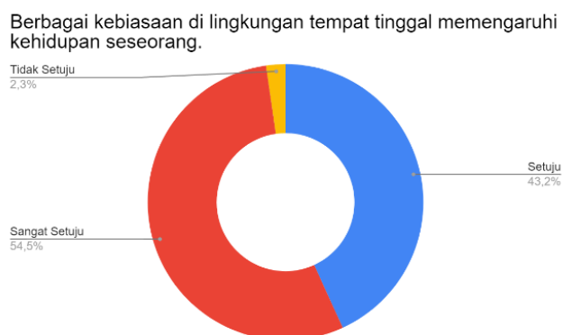
Gambar 3 : Diagram Hasil Pernyataan Pengaruh Lingkungan pada Seseorang

Sebagai contoh adanya pola hidup sehat yang akan membentuk cara seseorang menua. Meski banyak yang setuju bahwa kebiasaan dapat memengaruhi bagaimana seseorang hidup, 33 dari 44 responden sudah tidak mengikuti kepercayaan (pamali) yang ada disekitar mereka. Di Indonesia sendiri pamali masih tergolong cukup kuat di masyarakat itu sendiri, namun pada masa sekarang pamali mulai pudar seiring perkembangan zaman.