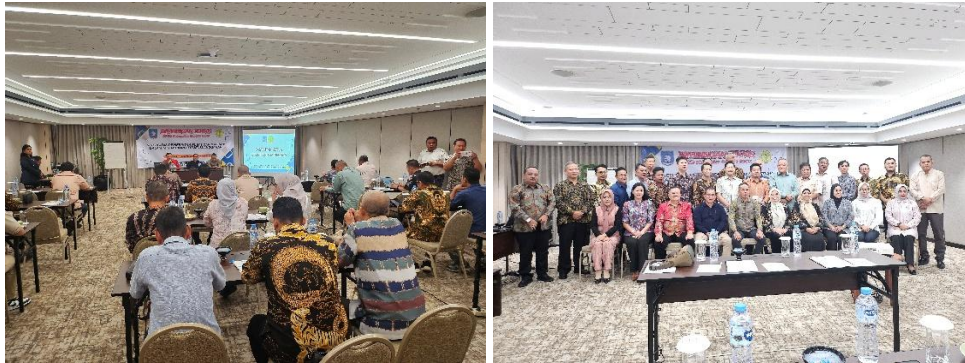
Gambar 2. Kegiatan dengan DPRD Kabupaten Bangka Barat

Adapun materi yang diberikan dalam kegiatan ini terdiri dari 3 materi yaitu Kebijakan Prioritas Pembangunan berdasarkan Musrenbang dan Pokok Pikiran DPRD, Keputusan Menteri Sosial Nomor 22/HUK/2026 Tentang Penetapan Peringkat Kesejahteraan Keluarga Untuk Penyaluran Bantuan Sosial dan Bantuan Program Kesejahteraan Sosial, serta Pengelolaan Keuangan Daerah yang Efektif dan Efisien, beserta Strategi dan Implementasi.