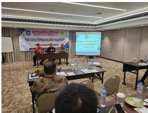
Gambar 1. Sarana dan Prasarana yang Dipersiapkan dalam Pelaksanaan Kegiatan

Sarana dan prasarana yang dipersiapkan untuk kegiatan ini antara lain room meeting dengan kelengkapan fasilitas ruangan seperti AC, sound system , meja, kursi, LCD, laptop, papan tulis, alat tulis untuk peserta, serta fotokopi bahan materi yang akan dipaparkan.