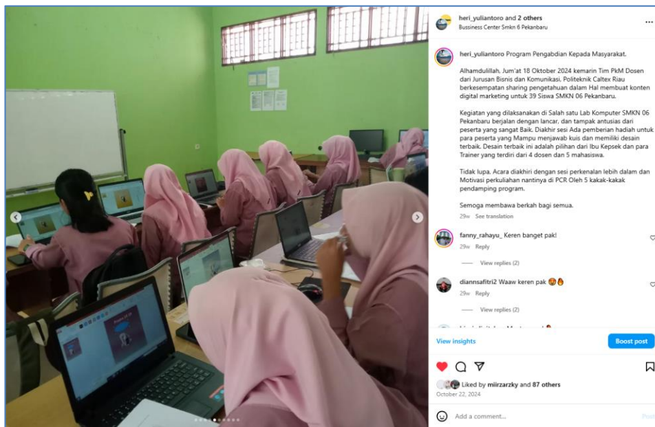
Gambar 4 Publikasi melalui Instagram Resmi Program Studi Akuntansi Perpajakan dan Ketua Pelaksana

Selain publikasi melalui situs resmi Politeknik Caltex Riau, publikasi juga dilakukan melalui media social Instagram resmi Program Studi Akuntansi Perpajakan, Politeknik Caltex Riau yang berkolaborasi dengan akun Instagram Ketua Pelaksana kegiatan Pengabdian Masyarakat seperti terlihat pada gambar berikut ini: