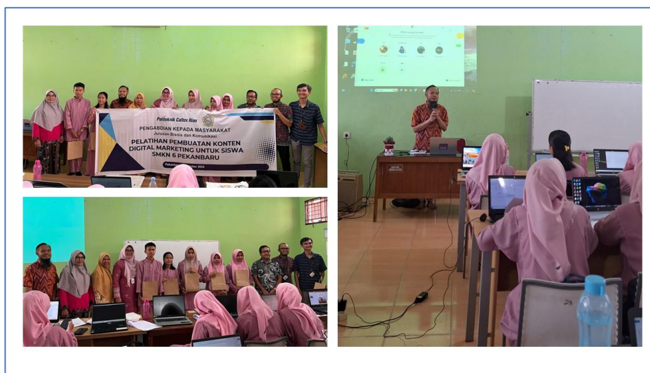
Gambar 2. Dokumentasi Kegiatan PkM

Selama kegiatan berlangsung tim juga mendokumentasikan selama kegiatan berlangsung. Berikut ini dokumentasi selama kegiatan berlangsung: