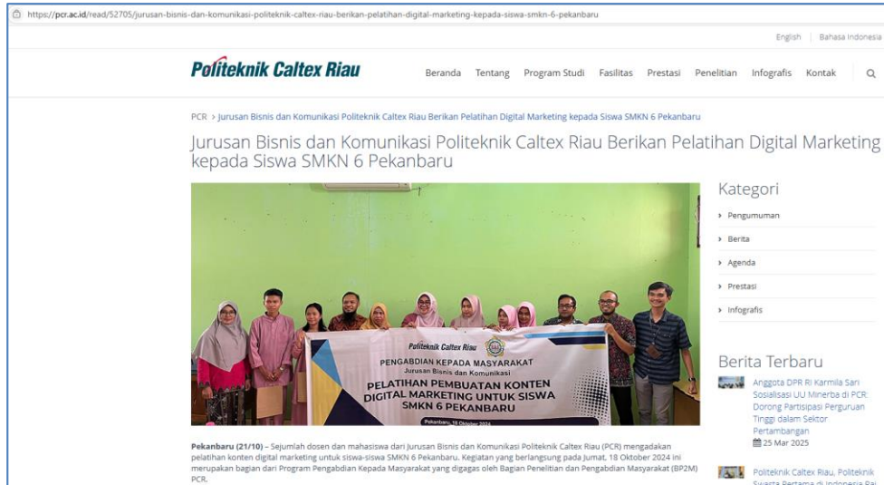
Gambar 3 Publikasi melalui Situs Resmi Politeknik Caltex Riau

Publikasi pada situs resmi Politeknik Caltex Riau tersebut dapat diakses melalui tautan berikut ini: https://bit.ly/PublikasiPKMSMKN6SitusPCR