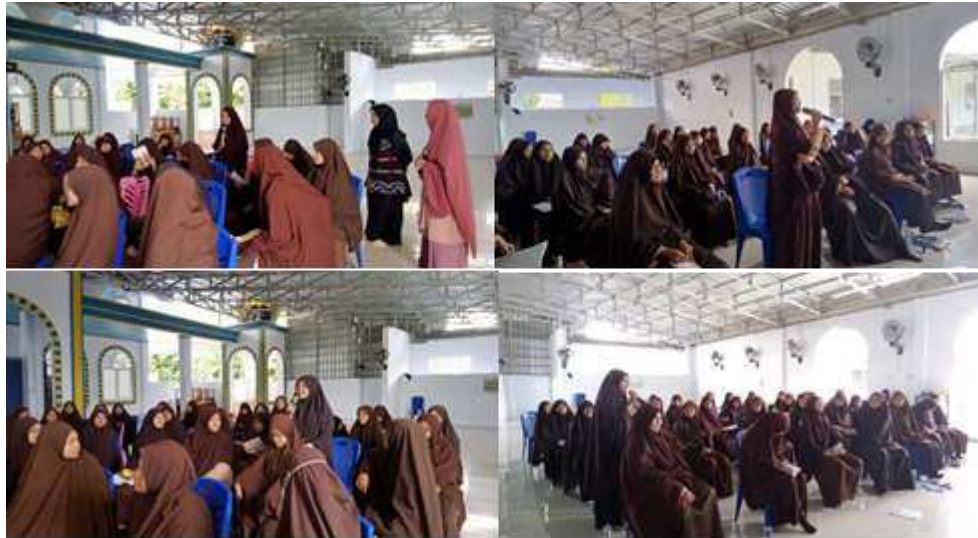
Gambar 4. Aktivitas Diskusi dan Tanya Jawab

Setelah sesi diskusi dan tanya jawab berakhir, dilanjutkan dengan kegiatan game atau permainan antar peserta. Game ini bertema pemilahan jenis-jenis sampah yang terdiri dari sampah organik, non-organik dan residu. Peserta dipilih dan dibagi menjadi 2 (dua) tim yang akan bermain game. Setiap tim terdiri dari 3 orang yang akan bermain dalam memilah-milah sampah berdasarkan jenisnya. Setiap tim diberikan waktu untuk memilah sampah berdasarkan jenisnya dan meletakkan sampah tersebut pada tempat yang sesuai. Gambaran permainan/game pemilahan jenis –jenis sampah dapat dilihat pada gambar 5 berikut.