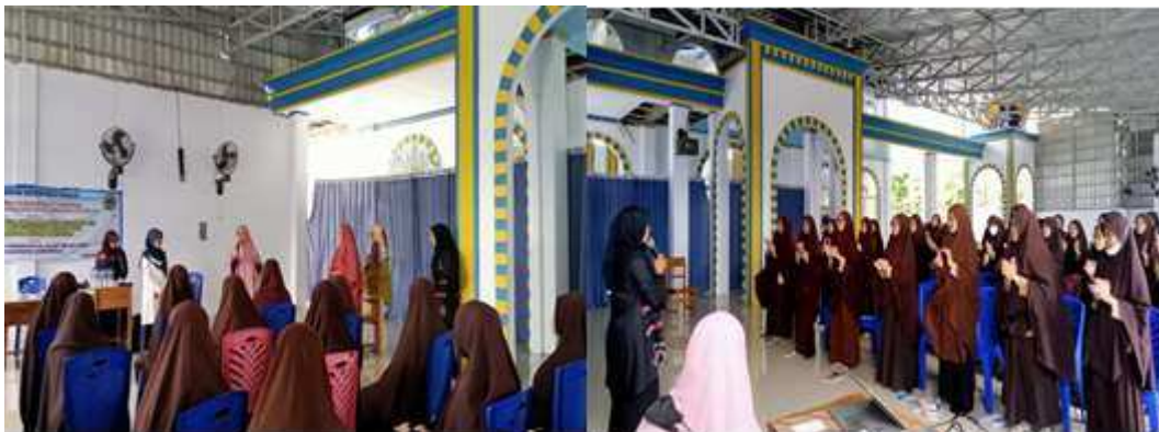
Gambar 5. Permainan/Game Pemilahan Sampah Berdasarkan Jenisnya

Setelah sesi diskusi dan tanya jawab berakhir, dilanjutkan dengan kegiatan game atau permainan antar peserta. Game ini bertema pemilahan jenis-jenis sampah yang terdiri dari sampah organik, non-organik dan residu. Peserta dipilih dan dibagi menjadi 2 (dua) tim yang akan bermain game. Setiap tim terdiri dari 3 orang yang akan bermain dalam memilah-milah sampah berdasarkan jenisnya. Setiap tim diberikan waktu untuk memilah sampah berdasarkan jenisnya dan meletakkan sampah tersebut pada tempat yang sesuai. Gambaran permainan/game pemilahan jenis –jenis sampah dapat dilihat pada gambar 5 berikut.