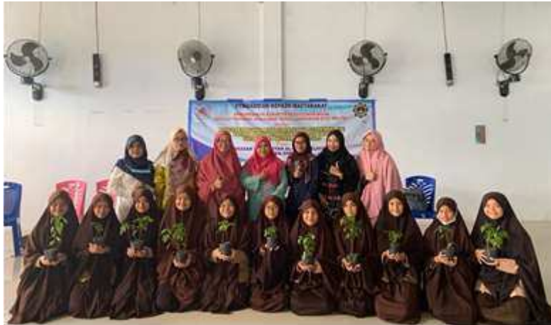
Gambar 6. Pemberian Bibit Tanaman Kepada Peserta