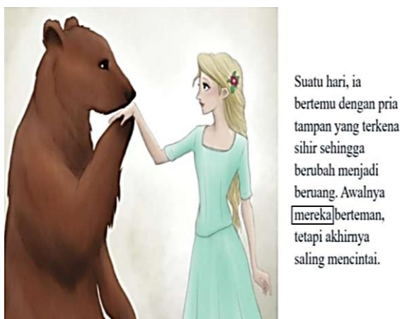
Gambar 3.3 Perbaikan Hasil Tulisan Siswa

dibuktikan dari hasil tulisan siswa yang telah memperhatikan dan memperbaiki struktur, tema, unsur kebahasaan, serta ejaan dan tanda baca yang tepat. Berikut salah satu contoh hasil tulisan siswa yang telah memperbaiki penggunaan kata ganti untuk menjaga konsistensi cerita pada gambar 3.3.