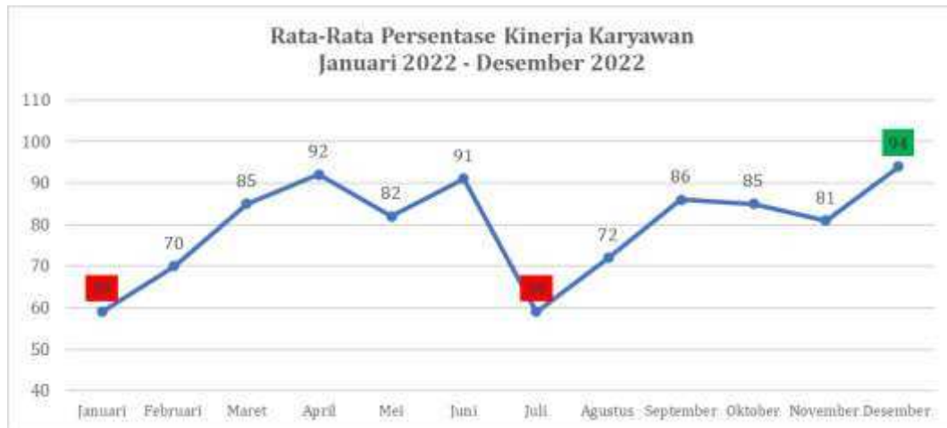
Gambar 1.2 Data Penilaian Kinerja Karyawan

Berdasarkan penilaian kinerja karyawan menunjukkan tidak konsistensinya capaian kerja dari karyawan selama tahun 2022. Inkonsistensi performa atau kinerja dari karyawan juga dapat berdampak pada output kinerja penjualan perusahaan, yaitu penjualan unit kendaraan KIA yang mengalami penurunan dari tahun sebelumnya. Kegiatan Pra-Survei selanjutnya dilakukan kepada 5 karyawan terpilih untuk mengeksplorasi faktor-faktor apa saja yang paling berdampak terhadap kinerja penjualan perusahaan di PT Indomobil Trada Nasional – KIA Kelapa Gading. Berdasarkan hasil Pra-Survei diketahui bahwa faktor yang memiliki dampak terhadap kinerja penjualan perusahaan adalah kepuasan kerja karyawan dan motivasi kerja karyawan. Hal ini didukung oleh penelitian sebelumnya dimana kepuasan kerja dapat memberikan dampak yang signifikan sehingga dapat memberikan dampak positif kepada kinerja penjualan. Studi ini dilakukan untuk dapat menggali lebih dalam terkait dengan pengaruh kepuasan kerja, motivasi kerja serta keduanya terhadap kinerja penjualan dari suatu perusahaan.