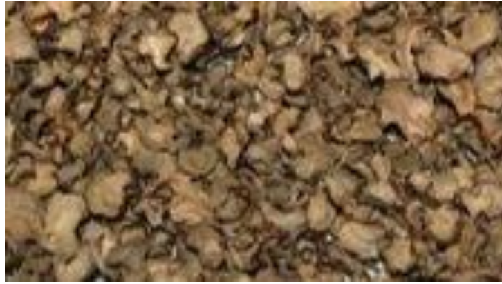
Gambar 3. Simplisia Kering Lengkuas

Produk lainnya yang dibuat yaitu Balsam Stik yang mengandung minyak atsiri lengkuas. Bahan tambahan lainnya yang digunakan dalam pembuatan balsam stik yaitu vaselin dan paraffin padat. Paraffin padat memberikan tekstur yang keras pada balsam, sedangkan vaselin bersifat emolien melembutkan.