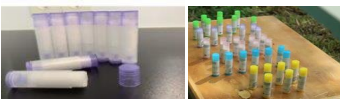
Gambar 4. Balsam Stik Lengkuas

Produk lainnya yang dibuat yaitu Balsam Stik yang mengandung minyak atsiri lengkuas. Bahan tambahan lainnya yang digunakan dalam pembuatan balsam stik yaitu vaselin dan paraffin padat. Paraffin padat memberikan tekstur yang keras pada balsam, sedangkan vaselin bersifat emolien melembutkan.