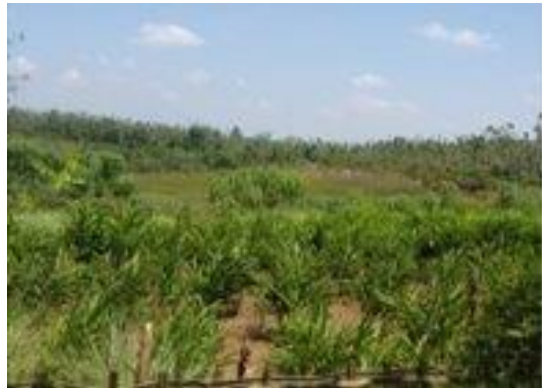
Gambar 1. Kegiatan Observasi Lahan PkM

Tahap selanjutnya yang dilakukan yaitu persiapan pembuatan disinfektan serta uji aktivitasnya dan produk balsam stik. Hasil yang diperoleh pada pembuatan disinfektan lengkuas secara organoleptis produk berbentuk cair, berwarna coklat, dan berbau aromatik. Pada pengujian aktivitas disinfektan didapatkan hasil bagian yang disemprot disinfektan tidak ditumbuhi mikroorganisme, sedangkan kontrol negatif yang tidak diberikan perlakuan ditumbuhi mikroorganismenya.