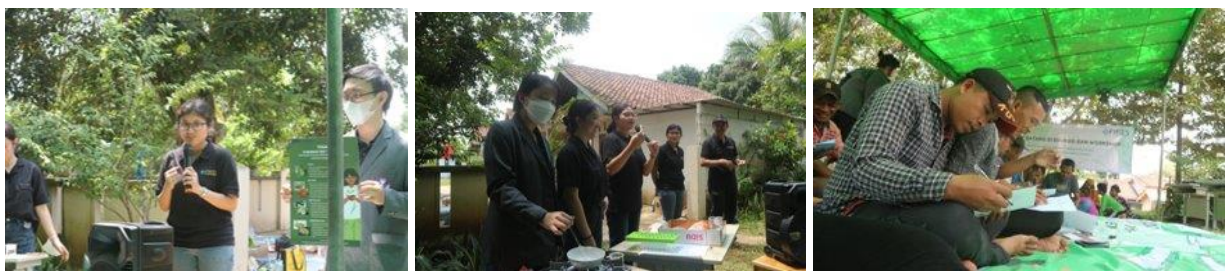
Gambar 5. Kegiatan PkM di Desa Batok

Pada pelaksanaan PkM 22 Maret 2023, kegiatan diikuti oleh 31 peserta. Peserta antusias dalam menerima materi edukasi TOGA dan workshop pembuatan produk desinfektan dan balsam stik.