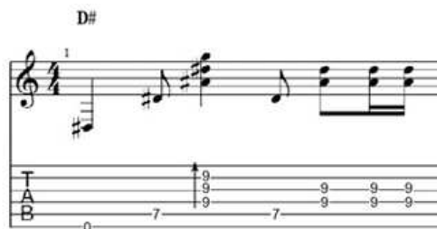
Gambar 7. Teknik chord melody

Sementara itu, tangan kanan harus bisa memetik senar dengan sentuhan yang halus dan terkontrol agar setiap nada terdengar jelas dan emosional. Yang membuatnya lebih menantang lagi, melodi sering berada di nada tertinggi dari akor yang dimainkan, jadi pemain harus benar-benar menjaga keseimbangan antara melodi dan harmoni. Teknik ini nggak cuma soal kemampuan teknis, tapi juga soal rasa bagaimana kita menyampaikan nuansa dan emosi lagu lewat setiap petikan. Teknik chord melody menjadi kunci bagi pemain gitar solo untuk menghadirkan permainan yang lengkap dengan menggabungkan melodi dan harmoni secara bersamaan dalam satu waktu (Johnson, P. 2017). Salah satu contoh chord melody bisa ditemukan pada birama ke-2.