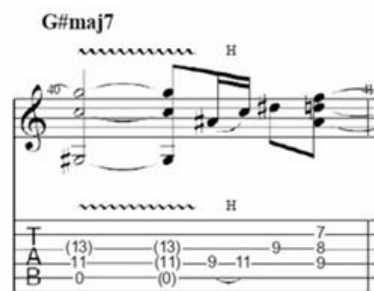
Gambar 4. Teknik vibrato

Terdapat beberapa bagian yang membutuhkan penguasaan teknik vibrato yang baik. Vibrato dalam permainan Mateus Asato bukan hanya sekedar hiasan nada, melainkan menjadi bagian penting dalam menyampaikan ekspresi dan nuansa emosional dari lagu tersebut. Teknik vibrato yang digunakan tidak hanya mengandalkan getaran jari biasa, melainkan juga melibatkan kontrol yang presisi, kestabilan tangan kiri, dan kepekaan terhadap dinamika lagu. Teknik ini menuntut sensitivitas pemain dalam menjaga kestabilan nada serta kehalusan dalam menggetarkan senar. Khususnya pada bagian chorus, vibrato yang digunakan cenderung lebih cepat dan dalam. Bagian ini cukup menantang karena pemain harus mampu menjaga kestabilan pitch sambil tetap mempertahankan intensitas emosional dari lagu. Salah satu contoh vibrato bisa ditemukan pada birama ke-40.