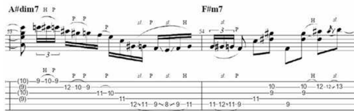
Gambar 5. Teknik legato