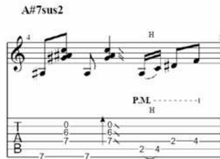
Gambar 1. Teknik hybrid picking

dimainkan dengan tepat dan penuh ekspresi. Teknik ini biasanya dilakukan dengan menggunakan pick untuk memetik senar bass (seperti E atau A), sementara jari tengah dan manis digunakan untuk memetik senar G, B, dan E. Salah satu contoh hybrid picking bisa ditemukan pada birama ke-4 yang dapat dilihat pada gambar notasi berikut.