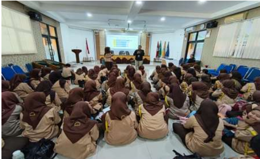
Gambar 1. Penyampaian materi

sebagai fasilitator dan evaluator. Suasana kegiatan dikondisikan agar mendekati situasi wawancara kerja sesungguhnya, sehingga siswa dapat berlatih secara realistis.