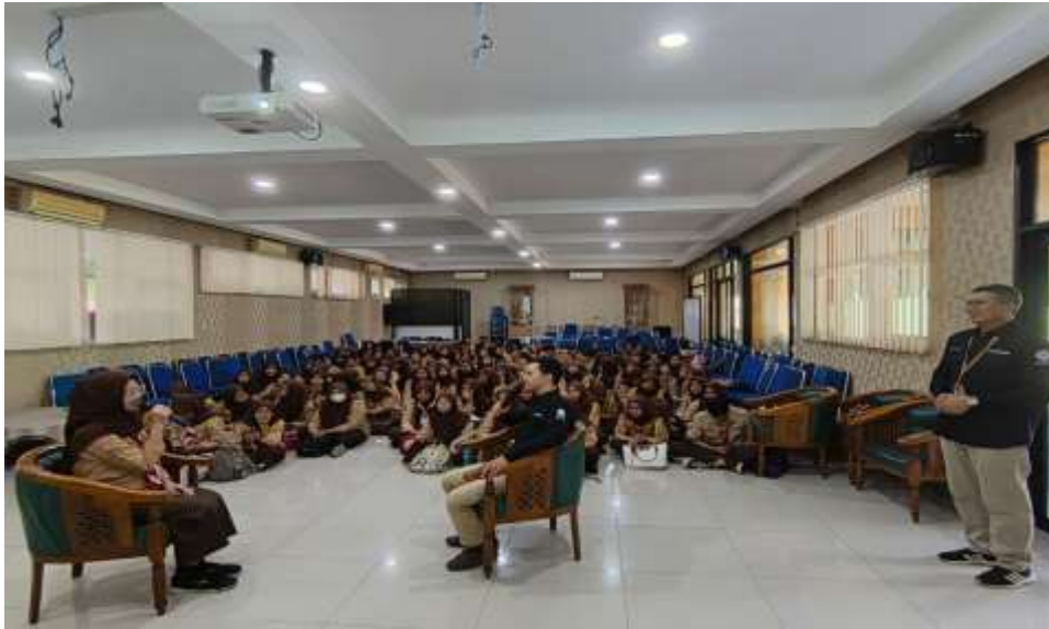
Gambar2.Diskusi dengan peserta