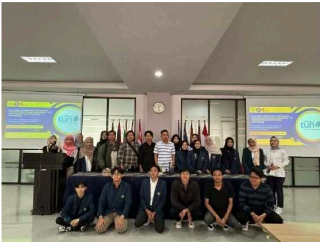
Gambar 3. Pemateri dan Peserta dalam Workshop Journalism Collaborative, 25 September 2024.

Implementasi pertama dari journalism collaborative adalah dengan content distribution . Distribusi konten dilakukan dengan menyajikan konten dari partner kepada audiens dan sebaliknya, umumnya dilakukan dengan berbagi konten dengan ruang redaksi lain untuk dipublikasikan di platform mereka. Implementasi dari content distribution adalah penyajian berita yang berasal dari kader Muhammadiyah yang berada di tingkat ranting ataupun cabang sebagai citizen journalism . Berita-berita yang didapatkan merupakan berita kegiatan kader ranting Persyarikatan. Para kader tersebut menjadi kontributor, sehingga berita-berita kegiatan di cabang dan ranting bisa terakomodir dan terpublikasi