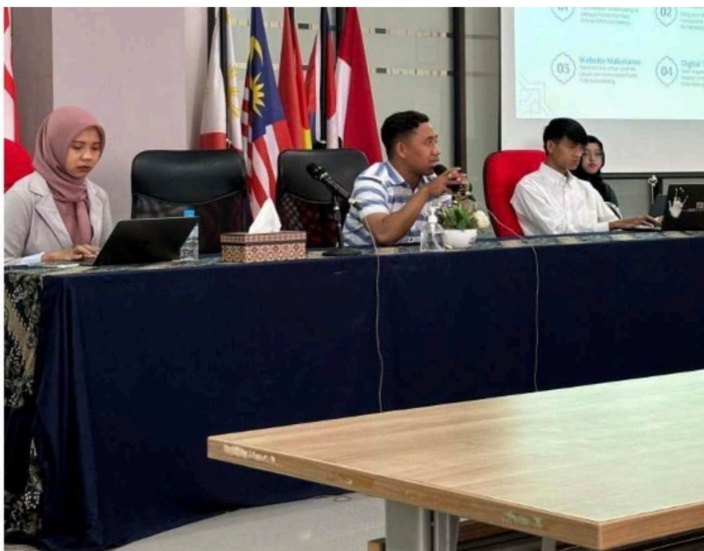
Gambar 2. Pemaparan Pemateri pada Pelatihan collaborative journalisme , 25 September 2024.

Kegiatan pengabdian masyarakat ini dilaksanakan dalam bentuk program magang yang bekerja sama dengan mahasiswa Fakultas Vokasi Universitas Brawijaya. Program magang ini melibatkan 4 mahasiswa Vokasi yang terdiri dari jurusan sistem informasi, teknik informasi, dan bisnis digital. Program magang ini menjadi jembatan permasalahan kurangnya SDM yang mengelola portal media Tunasmalang.id. Mahasiswa magang tersebut mengimplementasikan jurnalisme kolaboratif, dimulai dengan content sharing , content distribution , coordinated coverage , joint reporting , paralel reporting , source refferal , shared reporter , joint event hosting .