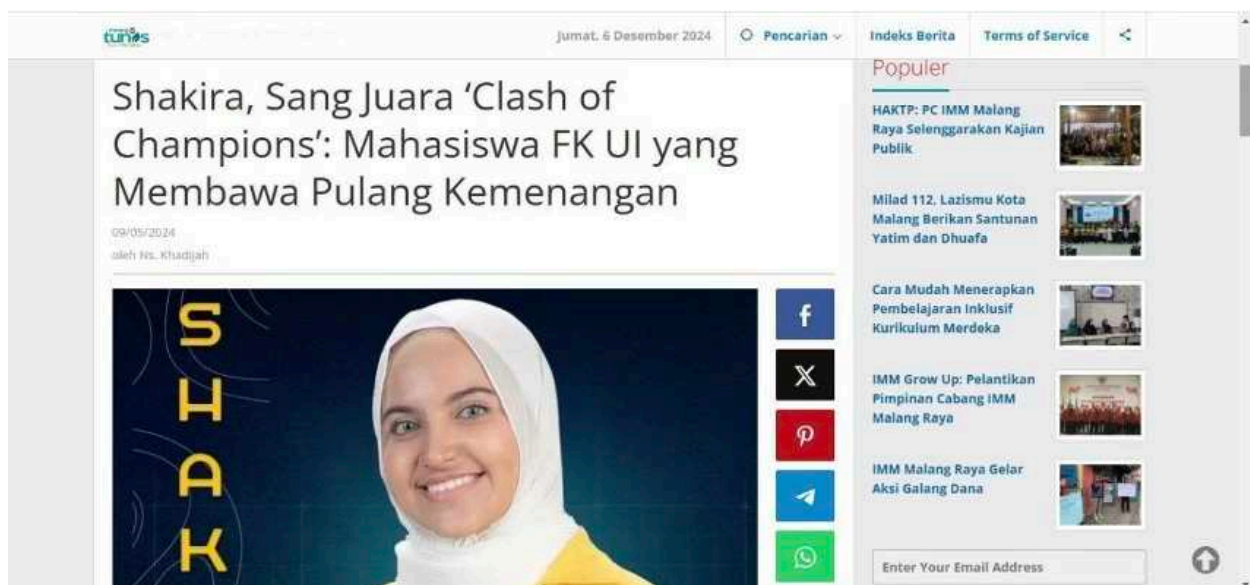
Gambar 5. Contoh artikel berita Tunasmalang.id tentang ketokohan

Terakhir, joint event hosting , umumnya dilakukan oleh beberapa ruang redaksi yang berkolaborasi untuk merencanakan dan mengelola acara berita untuk memberikan tingkat liputan yang lebih baik kepada khalayaknya melalui pembuatan acara berita di komunitas. Implementasi joint event hosting masih perlu peningkatan, karena fokus utama dari pengabdian masyarakat saat ini adalah produksi berita di portal Tunasmalang.id berjalan secara konsisten setiap harinya. Nantinya, jika sistem produksi berita di portal media tersebut telah tersusun secara ajeg, maka pengembangan media dilakukan dengan menjalin kerja sama antar media lokal ataupun komunitas masyarakat.