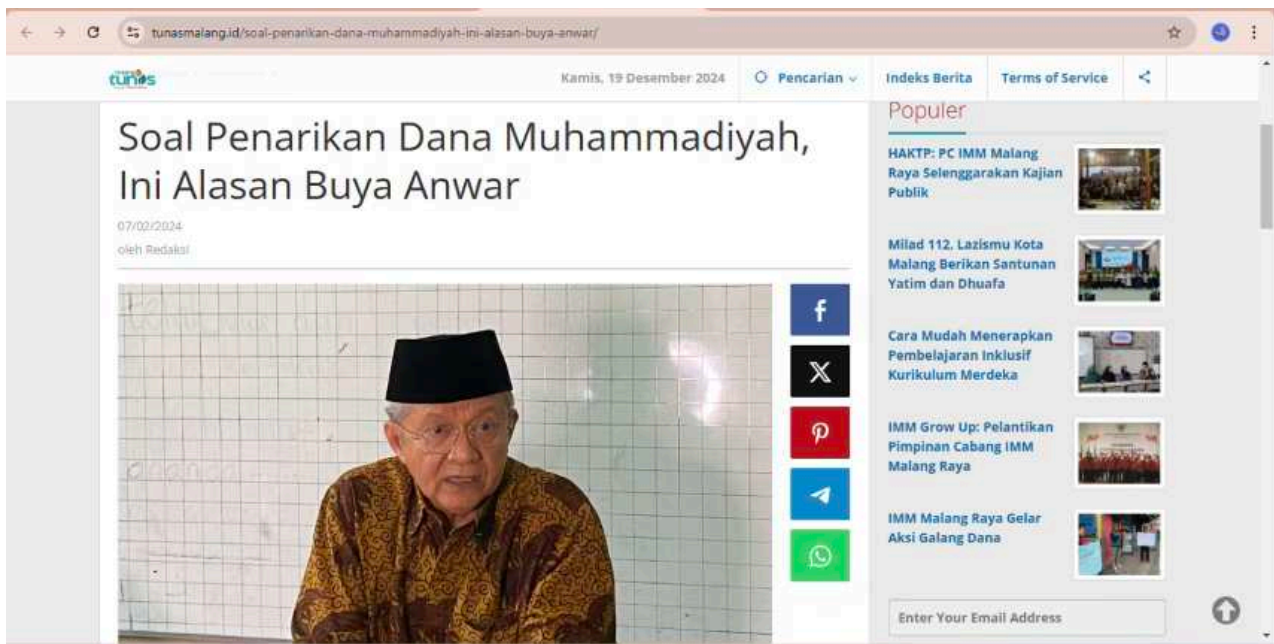
Gambar 4. Contoh artikel berita hasil joint reporting .

Lalu, shared reporter , pada praktiknya dilakukan dengan menggabungkan sumber daya untuk mendanai biaya reporter untuk topik atau lokasi tertentu. Sumber daya yang digunakan oleh produksi berita Tunasmalang.id dalam konteks ini didapat dari iklan-iklan dari institusi pendidikan yang ingin memasang profilnya di Tunasmalang.id. Selain itu, selama proses magang ini pendanaan liputan dari hibah pengabdian masyarakat. Bentuk-bentuk dukungan ini bertujuan untuk meningkatkan produksi berita dari Tunasmalang.id dan juga untuk memberikan suntikan semangat kepada manajemen Tunasmalang.id.