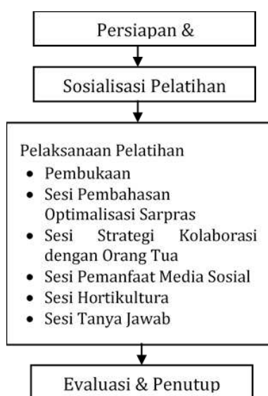
Gambar 1. Tahapan Kegiatan

Pelaksanaan program pengabdian kepada masyarakat terkait pelatihan ini dilaksanakan dalam satu hari dengan rangkaian kegiatan yang dirancang secara sistematis untuk membantu menyelesaikan permasalahan yang dihadapi oleh pihak sekolah maupun satuan pendidikan. Kegiatan ini difokuskan pada peningkatan pemahaman dan keterampilan guru dalam mengelola sarana prasarana, membangun kolaborasi dengan orang tua, serta memanfaatkan teknologi informasi dalam pembelajaran. Melalui sesi pelatihan yang interaktif, peserta mendapatkan wawasan baru serta solusi praktis yang dapat diterapkan langsung di sekolah masing-masing [23],[24]. Selain itu, kegiatan ini juga mendorong guru untuk lebih kreatif dalam menciptakan lingkungan belajar yang inklusif dan ramah anak. Pendekatan yang digunakan dalam pelatihan ini berbasis pada kebutuhan nyata di lapangan, sehingga diharapkan mampu memberikan dampak yang signifikan. Gambar 1 adalah tahapan kegiatan pengabdian kepada masyarakat yang kami lakukan.