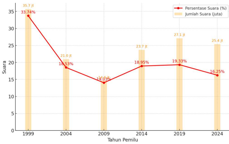
Gambar 1. Indeks Perolehan Suara PDIP Secara Nasional dari Pemilu Tahun 1999-2024

Sumber: Diolah dari Litbang Kompas dan KPU RI