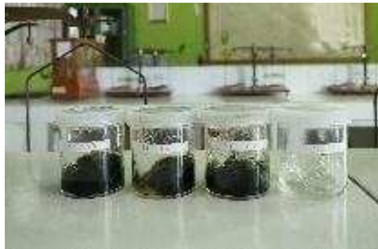
Gambar 1. Gel Moisturizer Ekstrak Etanol Daun Pepaya ( Carica papaya L )