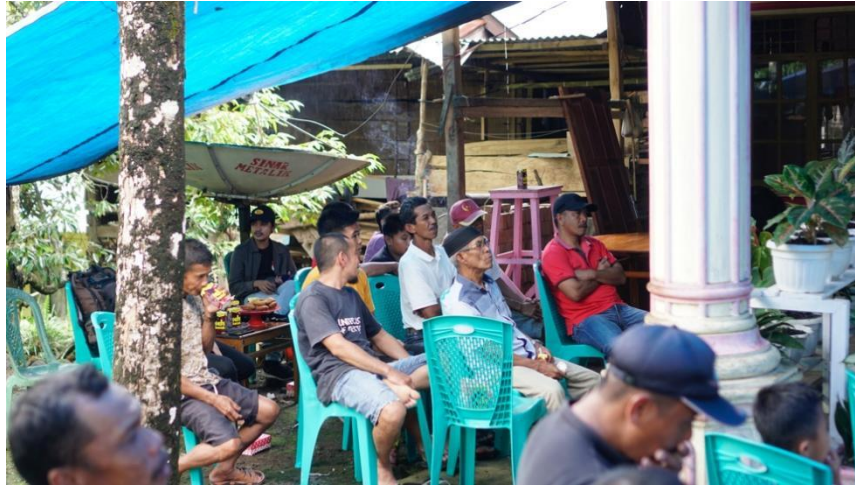
Gambar 6. Peserta menyimak materi kegiatan