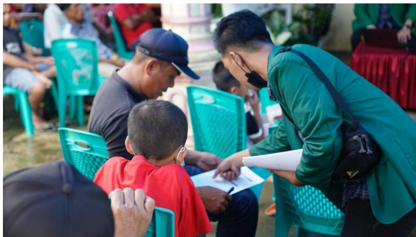
Gambar 5. Pengisian Pre dan Post test

Kegiatan penyuluhan dilaksanakan di balai dusun dengan melibatkan 38 orang petani yang merupakan anggota kelompok tani di Dusun Pumpikatu. Materi penyuluhan meliputi konsep dasar sistem mina padi, manfaat ekonomis dan ekologis, serta pengalaman keberhasilan di beberapa daerah lain. Penyampaian materi dilakukan secara interaktif menggunakan media presentasi, leaflet, dan diskusi kelompok. Hasil evaluasi awal menunjukkan peningkatan pemahaman petani terhadap konsep mina padi. Dari hasil pre-test dan post-test sederhana, skor rata-rata pengetahuan peserta meningkat dari 52% menjadi 83%. Petani mulai menyadari bahwa lahan sawah tidak hanya berfungsi sebagai tempat produksi padi, tetapi juga dapat dimanfaatkan untuk pemeliharaan ikan secara terpadu.