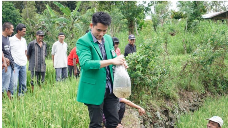
Gambar 2. Pelatihan dan Demistrasi