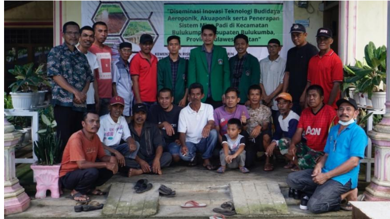
Gambar 4. Monitoring dan Evaluasi