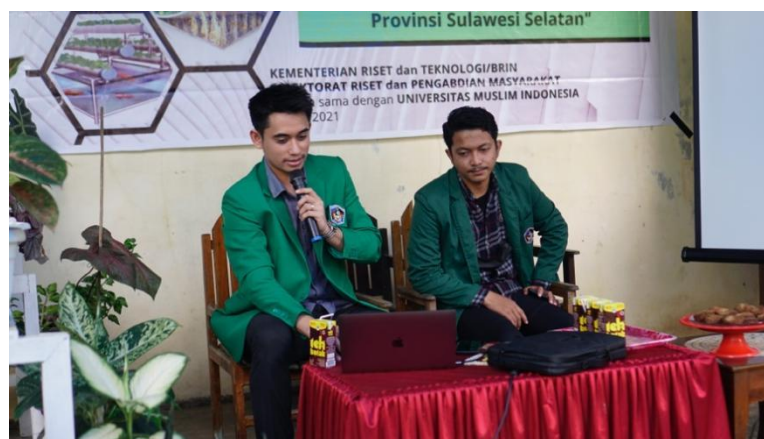
Gambar 1. Sosialisasi/ Penyuluhan