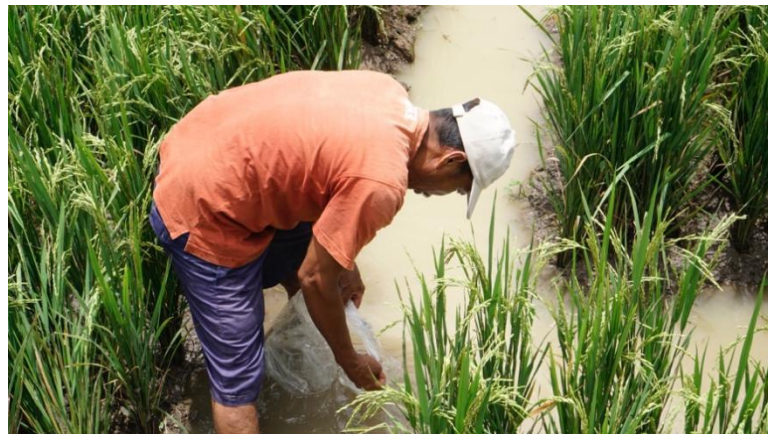
Gambar 3. Pendampingan