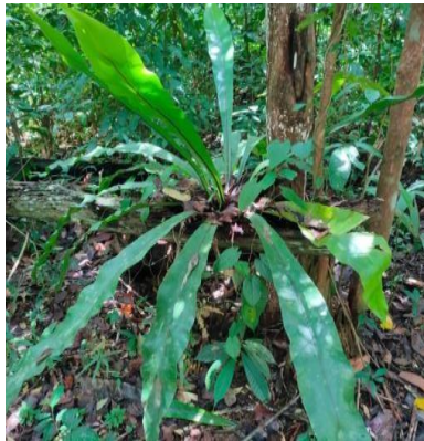
Gambar 2. Asplenium nidus L.