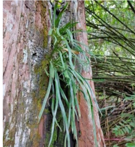
Gambar 14. Pyrrosia longifolia