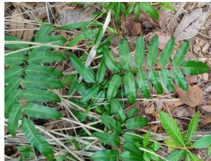
Gambar 3. Stenochlaena palustris (Burm) Bedd.