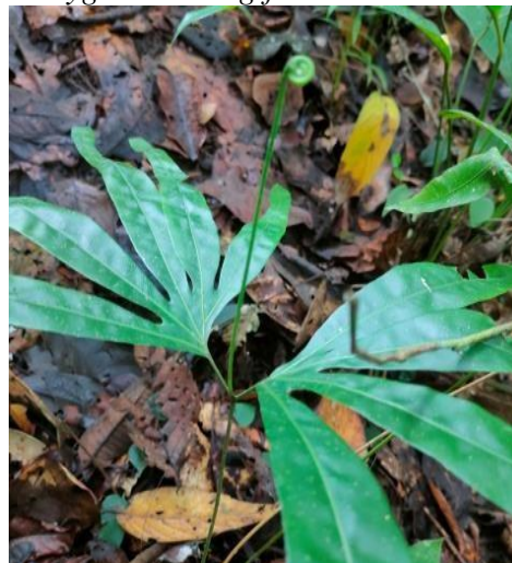
Gambar 10. Lygodium longifolium