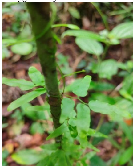
Gambar 9. Lygodium flexuosum