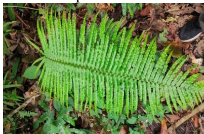
Gambar 4. Blechnum sp.