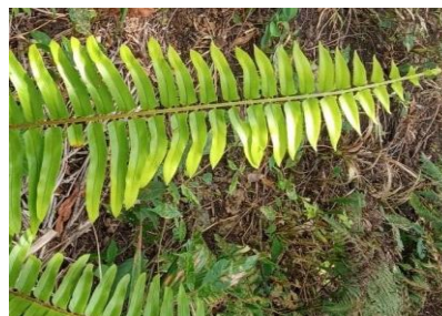
Gambar 6. Nephrolepis exaltata