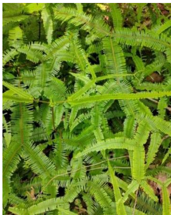
Gambar 7. Gleicneia linearis