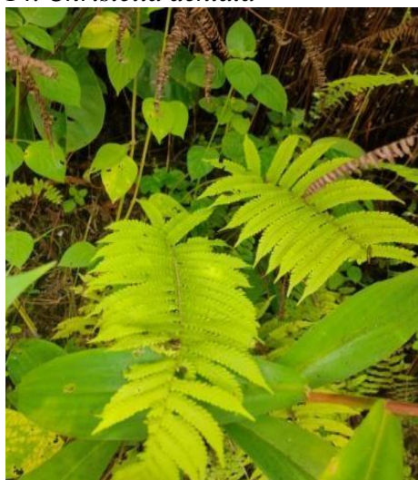
Gambar 15. Christella dentata