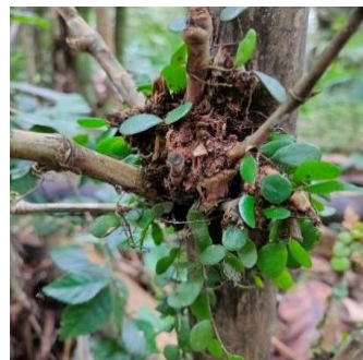
Gambar 12. Drymoglossum piloselloides