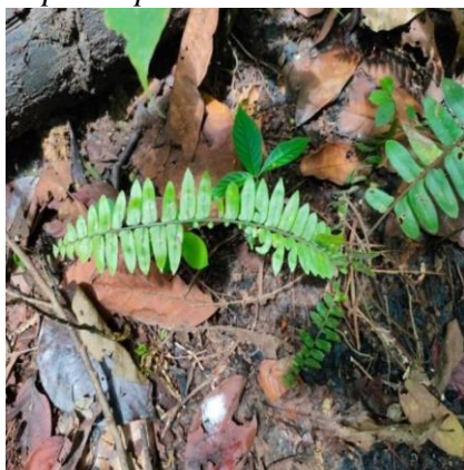
Gambar 11. Nephrolepis radicans