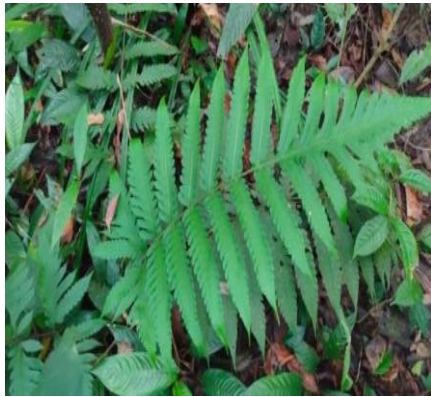
Gambar 13. Pleocnaema irregularis