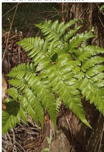
Gambar 5. Davalia denticulate