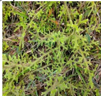
Gambar 8. Lycopodium cernuum L .