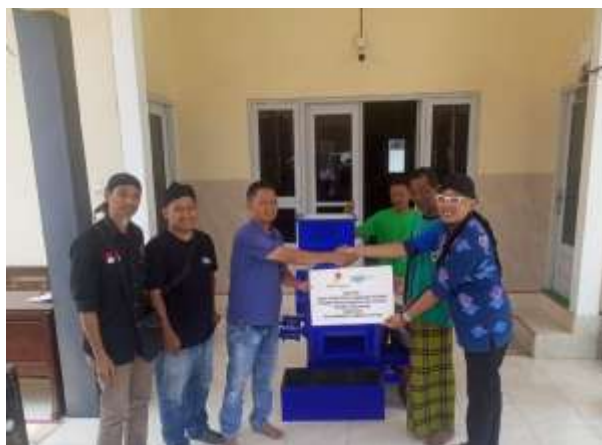
Gambar 2. Penyerahan Mesin di Desa Banyuurip Ujungpangkah Gresik

Luaran utama dari kegiatan pengabdian masyarakat melalui pelaksanaan Program Pengembangan Masyarakat (PPM) Bidang Lingkungan Saka Indonesia Pangkah Limited bekerjasama dengan Universitas Muhammadiyah Gresik ini adalah tersedianya mesin crusher cangkang kerang sebagai bentuk inovasi teknologi tepat guna yang diserahkan kepada mitra, yaitu BUMDes Banyuurip, untuk mendukung pengolahan limbah cangkang kerang di tingkat desa. Penyerahan mesin ini menunjukkan bahwa kegiatan tidak berhenti pada tahap sosialisasi dan pelatihan, tetapi juga menghasilkan produk nyata yang dapat langsung dimanfaatkan oleh masyarakat. Mesin crusher tersebut dirancang untuk membantu proses penghancuran limbah cangkang kerang menjadi ukuran yang lebih kecil sesuai kebutuhan, sehingga limbah yang sebelumnya menumpuk dan tidak termanfaatkan dapat diolah menjadi bahan baku yang memiliki nilai guna lebih lanjut. Selain luaran berupa alat, kegiatan ini juga menghasilkan peningkatan pengetahuan dan keterampilan masyarakat dalam mengoperasikan mesin, memahami alur pengolahan limbah cangkang kerang, serta mengenali potensi pemanfaatannya sebagai produk bernilai tambah. Dengan demikian, luaran kegiatan ini mencakup aspek fisik dan nonfisik, yaitu berupa mesin crusher sebagai produk teknologi tepat guna, peningkatan kapasitas masyarakat desa, serta terbukanya peluang pengembangan usaha berbasis pengolahan limbah cangkang kerang secara berkelanjutan.