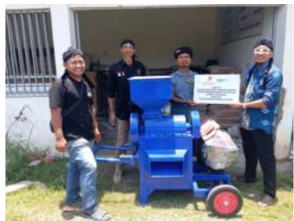
Gambar 3. Penyerahan Mesin di Desa Ngemboh Ujungpangkah Gresik