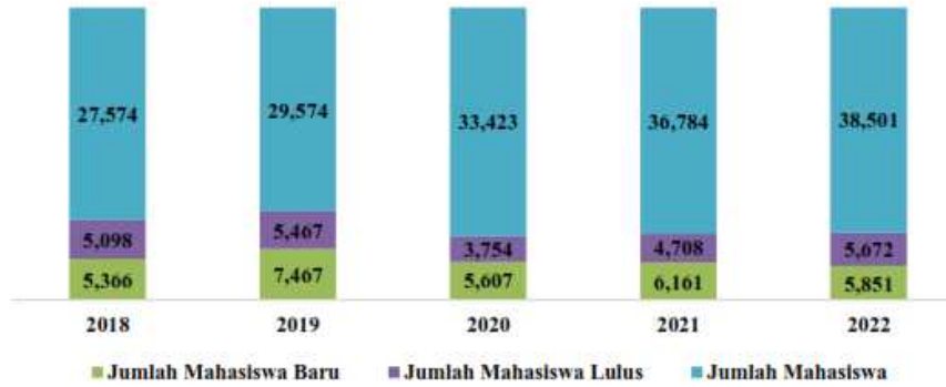
Gambar 1. Grafik Presentase Status Mahasiswa Unmul (hingga Desember 2022)