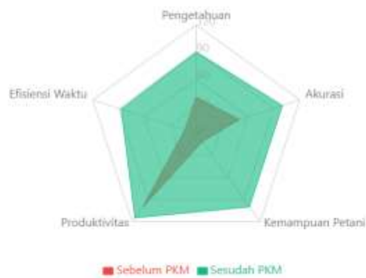
Gambar 3. Perbandingan Komprehensif (Radar Chart)