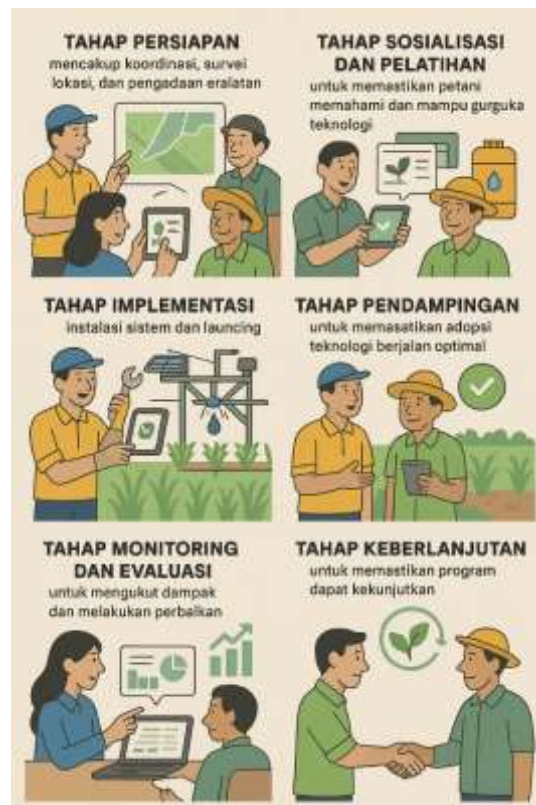
Gambar 1 Tahapan Pelaksanaan Kegiatan

Metode Pelaksanaan Penerapan Alat Ukur pH Tanah Digital Otomatis dan Aplikasi Pendukung bagi Masyarakat Tani Gapoktan Sri Karya dapat dilihat pada tahapan atau langkah-langkah sebagai berikut: