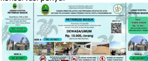
Gambar 2. Tiket Masuk Konservasi Penyu Pangumbahan

QR Code banyak diaplikasikan dalam berbagai kehidupan sehari-hari. Pemanfaatan ini QR banyak membantu karena keefektifannya dalam menyimpan informasi. Pengembangan wisata di Satpel perlu dikembangkan dan mengikuti zaman modern, salah satunya dengan digitalisasi termasuk dalam penyampaian informasi. Pemasangan informasi konservasi penyu ke dalam kode QR di tiket masuk ke konservasi penyu merupakan inovasi penting dalam upaya edukasi lingkungan. Dengan menggunakan teknologi QR, wisatawan dapat dengan mudah mengakses informasi mendalam mengenai upaya konservasi penyu hanya dengan memindai kode yang tersedia di tiket masuk konservasi penyu.