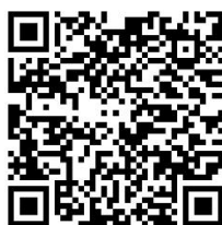
Gambar 3. QR Code Informasi Konservasi Penyu Pangumbahan

Informasi yang disajikan dapat mencakup berbagai aspek seperti peran penting penyu terhadap ekosistem laut, ancaman yang mereka hadapi, serta langkah-langkah yang dapat diambil oleh wisatawan masyarakat untuk membantu melestarikan penyu. berikut isi konten informasi konservasi penyu dalam qr code.