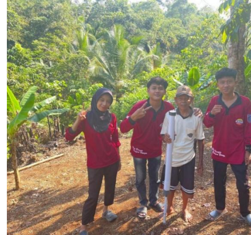
Gambar 2. Penyatuan