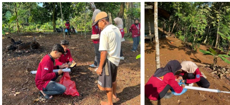
Gambar 1. Pemotongan dan Pelubangan Pipa dan Perakitam Mekanisme