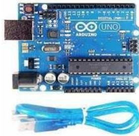
Gambar 1. Arduino Uno

Salah satu kelebihan dari mikrokontroler Arduino adalah kemudahan dalam mengatur dan mengendalikan input dan output digital dan analog, sehingga dapat diaplikasikan dalam berbagai macam proyek seperti pembuatan sistem kontrol, sistem monitoring, sistem otomatisasi, dan proyek-proyek lainnya. Selain itu, mikrokontroler Arduino juga dapat digunakan sebagai alat pembelajaran dalam mempelajari dasar-dasar elektronika dan pemrograman.