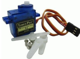
Gambar 4. Bentuk fisik motor servo

Sinyal kendali untuk motor servo umumnya dikirim dalam bentuk pulsa PWM (Pulse Width Modulation) yang dikenal sebagai sinyal PPM (Pulse Position Modulation) atau sinyal RC (Radio Control). Sinyal ini mengatur posisi sudut putar motor dan memungkinkan pengguna untuk mengontrol motor servo dengan mudah dan presisi.