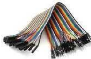
Gambar 2. Kabel jumper

Kabel jumper tersedia dalam berbagai panjang dan warna, dan dapat di beli di toko komponen elektronik atau toko online yang menyediakan perlengkapan untuk proyek elektronik.