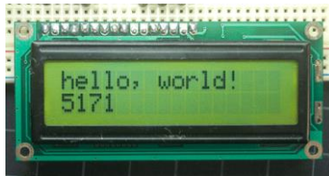
Gambar 5. Bentuk fisik LCD

Layar LCD digunakan dalam berbagai aplikasi, termasuk dalam perangkat elektronik seperti smartphone, laptop, TV, kamera digital, dan perangkat elektronik lainnya. Layar LCD memiliki keuntungan dibandingkan dengan teknologi layar tampilan lainnya, seperti tampilan CRT (Cathode Ray Tube), yaitu lebih tipis, lebih ringan, dan lebih hemat energi. Selain itu, layar LCD juga dapat menampilkan gambar yang lebih tajam dan memiliki sudut pandang yang lebih luas.