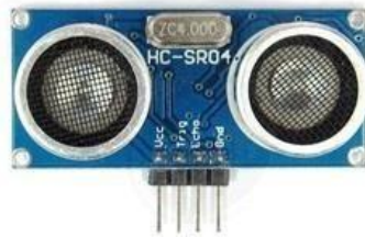
Gambar 3. Sensor ultrasonic

Sensor ultrasonik umumnya digunakan dalam berbagai aplikasi, termasuk dalam kendaraan untuk sistem parkir otomatis, pengukuran level air dalam tangki, dan bahkan dalam pengukuran jarak dalam robotika dan pemrosesan gambar.