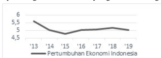
Gambar 1 Perumbuhan Ekonomi Indonesia

Pendahuluan terdiri dari rangkuman Sejalan dengan adanya perdagangan bebas dan perkembangan ekonomi global membuat setiap negara harus bersiap akan persaingan dunia bisnis yang terus meningkat.