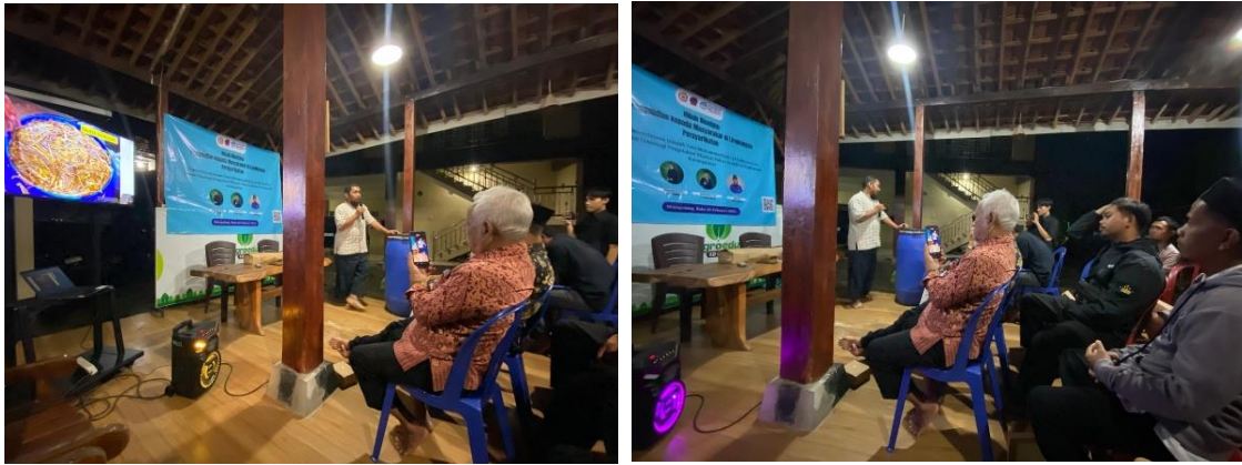
Gambar 2. Sosialisasi dan Demo pembuatan silase hijauan pakan