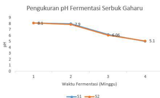
Gambar 2. Perubahan pH rata-rata selama proses fermentasi serbuk gaharu minggu ke-1, 2, 3 dan 4. Keterangan: S1: sampel pertama, S2: sampel kedua.

Selama proses fermentasi dilakukan pengamatan pH yang hasilnya menunjukkan bahwa terjadi perubahan derajat keasaman seiring dengan lamanya fermentasi. Kondisi pH rata-rata pada proses fermentasi ini adalah 8.1 (GF1), 7.9 (GF2), 6.1 (GF3) dan 5.1 (GF4) (Gambar 2). Penurunan pH sampai 5.1 tidak terjadi pada penelitian sebelumnya dengan praperlakuan microwave yang kisaran pHnya sekitar 7 pada minggu ke-3 dan ke-4. Ini menunjukkan bahwa penurunan pH disebabkan karena adanya aktivitas enzimatik dari Fusarium itu sendiri dalam perendaman serbuk gaharu. Fusarium sp membutuhkan energi untuk keberlangsungan hidupnya. Energi tersebut diperoleh dari carbon source yang ada pada serbuk gaharu dengan cara memetabolisme karbohidrat kompleks menghasilkan senyawa-senyawa lain yang bersifat asam seperti asam fumarat, asam sitrat, dan asam fusarat (Bacon et al., 1996; Farooq, 2015).