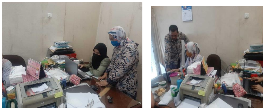
Gambar 6. Foto Kegiatan Pengabdian Kepada Masyarakat