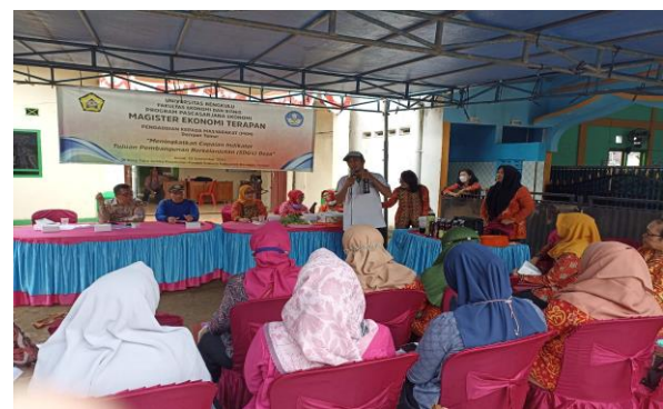
Gambar 3. Kegiatan penyuluhan kegiatan pengabdian kepada masyarakat oleh kepala

Pada kegiatan ini, tim pengabdian membuka sesi diskusi dan Tanya jawab untuk meningkatkan pemahaman masyarakat tentang cara meningkat-