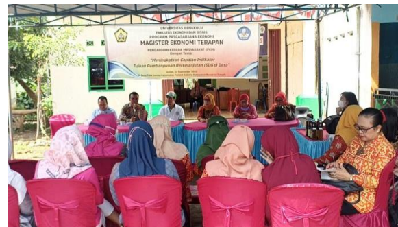
Gambar 2. Kegiatan Pembukaan Kegiatan Pengabdian Kepada Masyarakat oleh Kepala

Selain itu, potensi ketiga yang dapat dikembangkan di Desa Taba Jambu seperti pembuatan peternakan. Hal ini disebabkan karena Desa Taba Jambu memiliki lahan yang cukup untuk peternakan, BUMDes bisa mengembangkan usaha peternakan sapi, kambing, atau unggas. Hasil ternak ini bisa dipasarkan baik sebagai daging segar atau produk olahan seperti susu atau keju. Selain itu, bisa juga dikembangkan usaha pembuatan pakan ternak. Dengan potensi hasil pertanian yang ada, BUMDes juga bisa mengembangkan usaha pembuatan pakan ternak dari bahan lokal yang berlimpah. Dengan potensi-potensi tersebut, Desa Taba Jambu dapat mengembangkan BUMDes yang berfokus pada sektor-sektor yang memanfaatkan sumber daya alam dan kearifan lokal, sambil mendukung keberlanjutan lingkungan dan kesejahteraan masyarakat desa.