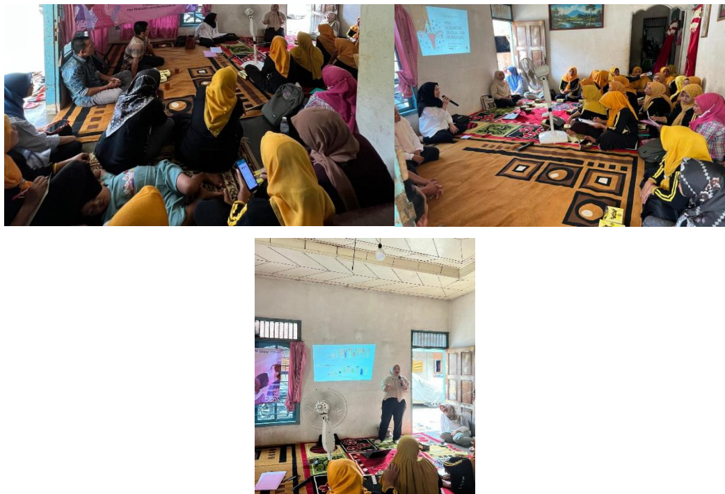
Gambar 2. Dokumentasi Kegiatan