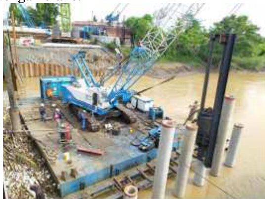
Gambar 1. Ponton