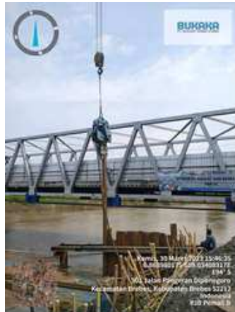
Gambar 9. Pemasangan SSP

Sheet pile dengan material ini paling sering dipakai karena memiliki kekuatan merata, berat sendiri yang relatif ringan dan waktu penggunaan yang relatif tahan lama. Sheet pile jenis ini memiliki sifat korosif, oleh karena itu penggunaannya perlu dipertimbangkan dengan baik. Interlok pada tiang turap dibentuk seperti jempol-telunjuk atau bola-keranjang untuk hubungan yang ketat untuk menahan air.