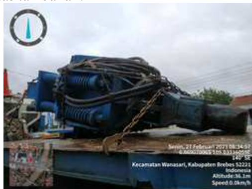
Gambar 6. Vibrator Pile Driver

Vibrator pile driver untuk pemancangan Steel Site Pile memiliki beberapa komponen utama, termasuk: