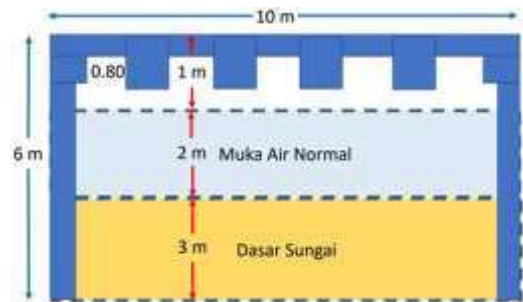
Gambar 11. Sketsa Guide Beam

Keterangan : Pondasi Guide Beam dipancang masuk 3 m ke dalam dasar sungai