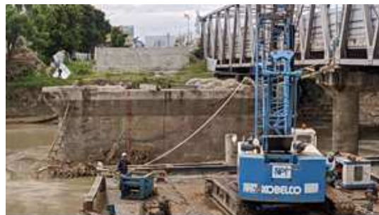
Gambar 10. Posisi Guide Beam

Melakukan pemasangan Guide Beam yang berfungsi sebagai penahan agar Spun Pile dapat berdiri tegak pada saat dilakukan pemancangan.