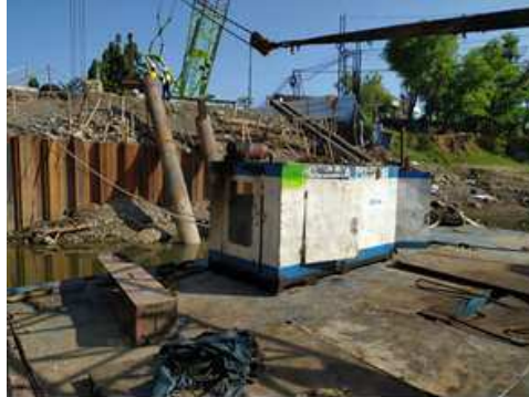
Gambar 8. Genset

Genset pada pemancangan di atas air (waterborne pile driving) digunakan sebagai sumber daya listrik untuk mengoperasikan peralatan pemancangan, termasuk vibrator pile driver, di atas permukaan air. Proses pemancangan di atas air sering digunakan dalam konstruksi jembatan, dermaga, atau struktur lain yang memerlukan pemancangan tiang pancang di lingkungan air.