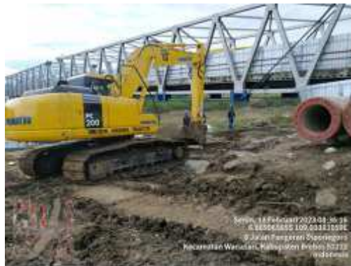
Gambar 13. Mobilisasi Peralatan

Mobilisasi peralatan merupakan peralatan apa saja yang akan di pakai dalam mengerjakan pemancangan dan persiapan peralatan tersebut harus dilakukan secepat dan seefisien mungkin agar pemancangan berjalan lancar.