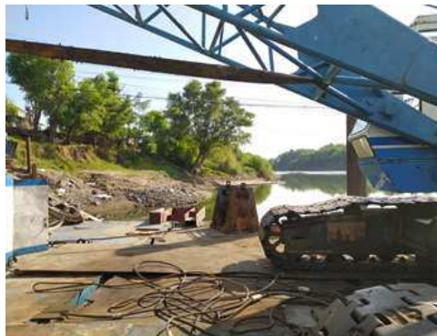
Gambar 7. Hand Winch

Hand Winch pada ponton adalah jenis mekanisme penggerak yang digunakan untuk mengoperasikan katrol sling ponton secara manual. Hand winch adalah perangkat yang terdiri dari drum bergerigi yang dioperasikan dengan menggunakan tangan atau tuas untuk membuka atau mengencangkan tali sling.