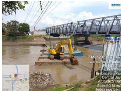
Gambar 12. Normalisasi Sungai

Normalisasi sungai adalah proses yang melibatkan perubahan atau modifikasi alami sungai untuk menciptakan kondisi yang lebih stabil dan terkendali. Normalisasi sungai sering dilakukan dalam proyek konstruksi jembatan yang melibatkan penggunaan landasan ponton.