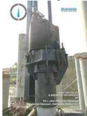
Gambar 5. Flying Hammer