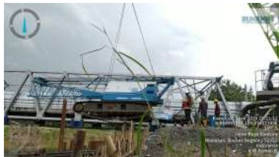
Gambar 14. Pемindahan Crane

Proses pemindahan Crane ke Ponton untuk persiapan pemancangan di atas air.