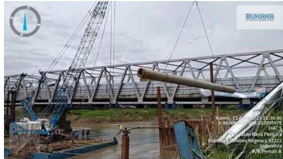
Gambar 15. Pemindahan Spun Pile