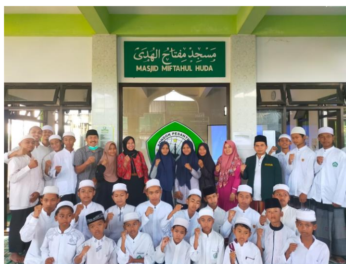
Gambar 3. Evaluasi pelatihan dan pendampingan

Evaluasi pelatihan dan pendampingan dilakukan melalui dua pengujian yaitu mengerjakan soal teori yang telah diberikan dan praktik menyusun laporan keuangan sesuai dengan yang diajarkan.