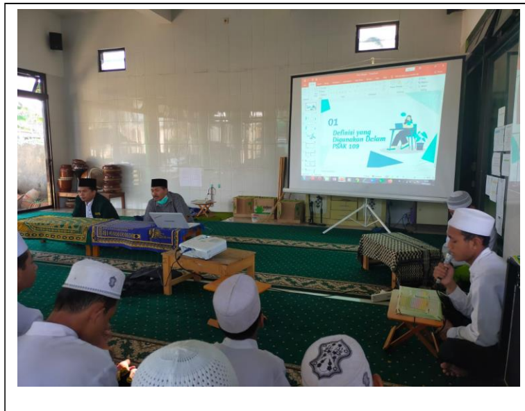
Gambar 2. Proses Penyampaian Materi

Metode kegiatan yang digunakan dalam pelatihan penyajian laporan keuangan adalah sebagai alat kontrol akan transparansi dan akuntabel laporan keuangan pondok pesantren Miftahul Huda dan ketepatan waktu dalam pelatihan yang akan dilakukan dengan cara: