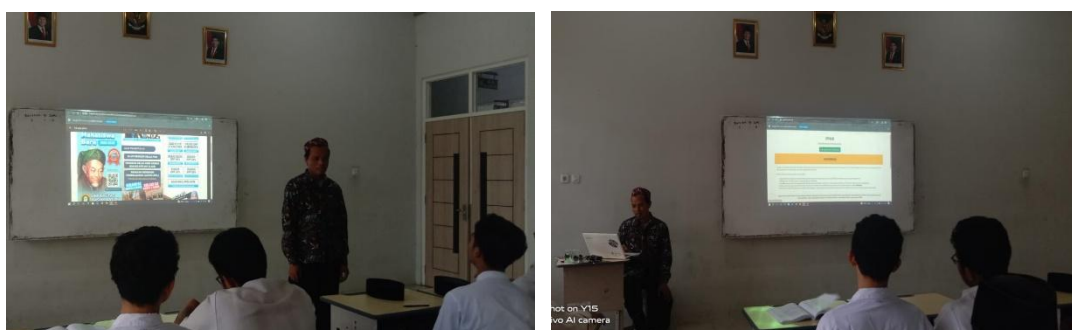
Gambar 2. Pelatihan Literasi Digital Kepada siswa

92%. Materi pelatihan disesuaikan dengan kebutuhan aktual santri, meliputi pembuatan akun email, penggunaan portal pendaftaran beasiswa, pengunggahan dokumen digital, hingga penyusunan motivation letter. Proses pelatihan berlangsung interaktif, dengan santri tidak hanya mendengarkan, tetapi langsung mempraktikkan keterampilan yang diajarkan. Tingginya partisipasi ini menunjukkan bahwa literasi digital bukan sekadar kebutuhan tambahan, melainkan kebutuhan mendasar yang benar-benar dirasakan oleh santri. Melalui pelatihan ini, santri diperkenalkan pada dunia digital secara lebih aplikatif, sehingga mereka dapat membangun kepercayaan diri dalam menggunakan teknologi untuk tujuan pendidikan.