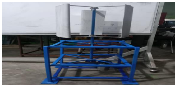
Gambar 1 Wind Turbine Jenis Darrieus Tipe H