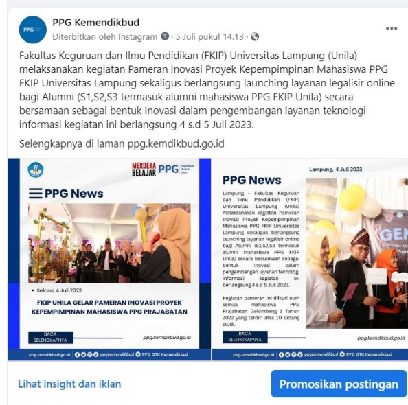
Gambar 3. Konten Facebook PPG Kemendikbud