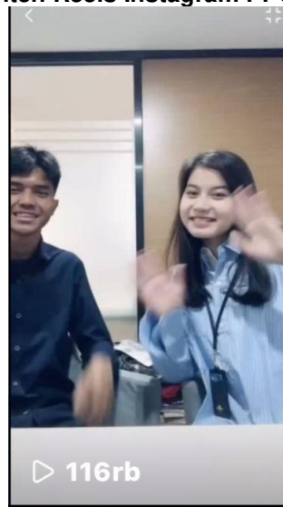
Gambar 5. Konten Reels Instagram PPG Kemendikbud