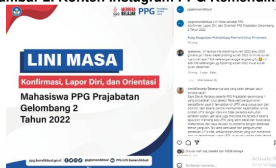
Gambar 2. Konten Instagram PPG Kemendikbud