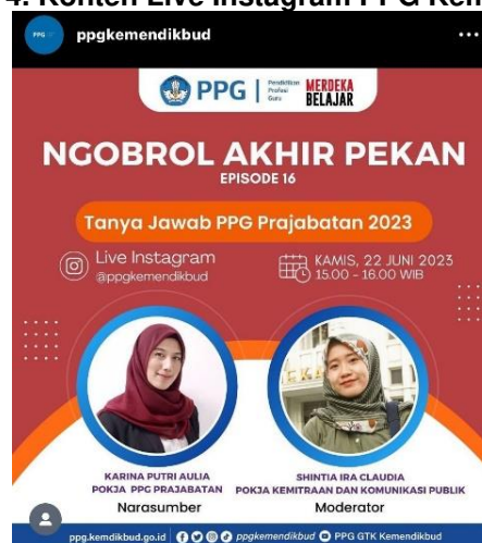
Gambar 4. Konten Live Instagram PPG Kemendikbud