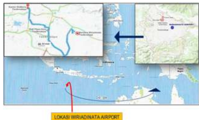
Gambar 1. Lokasi Penelitian, Bandara Udara Wiriadinata

Lokasi penelitian menjelaskan tempat penelitian. Penelitian dilaksanakan pada Bandara Udara Wiriadinata Tasikmalaya Direktorat Jenderal Perhubungan Udara yang merupakan sebagai unit penyelenggara bandar udara yang berlokasi di Tasikmalaya.