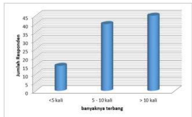
Gambar 3. Frekuensi penggunaan moda transportasi udara

Distribusi data yang menggambarkan frekuensi responden dalam menggunakan moda transportasi disajikan pada Gambar 3: