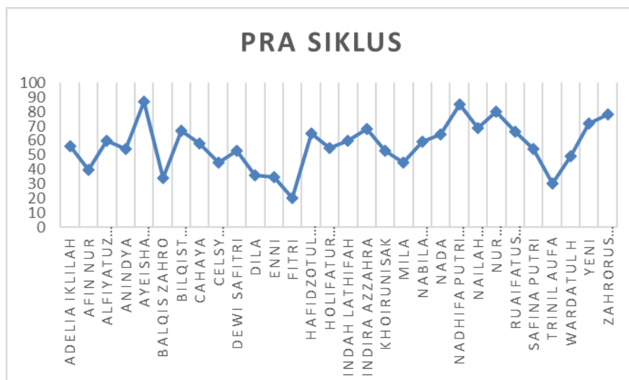
Gambar 1. Data Nilai Pra Siklus Kelas XII Bahasa2

Langkah awal dalam penelitian ini adalah observasi guna mengidentifikasi masalah yang terjadi saat proses pembelajaran dan sebagai upaya untuk mencari Solusi. Peneliti melakukan wawancara dengan guru dan siswa di kelas yang akan dijadikan PTK yakni kelas XII Bahasa2 MA Nurul Jadid. Kemudian mengambil data nilai siswa dengan melakukan postest. Dari hasil post tes tersebut menunjukkan bahwa hanya ada 5 dari 30 siswa yang nilainya diatas KKM, hasil post tes dapat dilihat pada gambar 1.