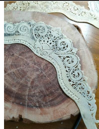
Gambar 5. Sesudah mbedahi