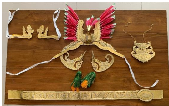
Gambar 11. Aksesoris kulitan tari gagrak Yogyakarta (Foto: Rohmad Eko, 2024)

Proses ini merakit atau menggabungkan komponen-komponen yang diperlukan untuk pemasangan aksesoris. Untuk jamang diperlukan finishing pemasangan bulu atau elar, kemudian untuk kalung dirakit dipasangkan menggunakan rantai, untuk sumping diberi gombyok untuk menambah estetika sumping.