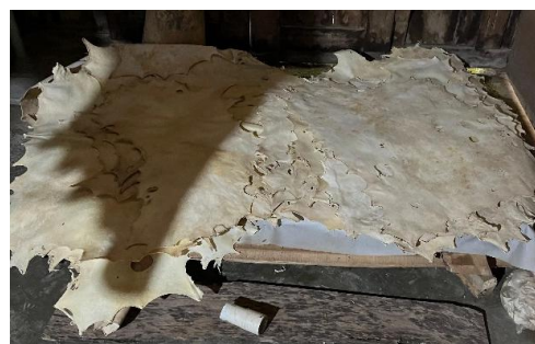
Gambar 2. Kulit perkamen

Pada pembuatan aksesoris kulitan tari menggunakan kulit dengan samak perkamen.