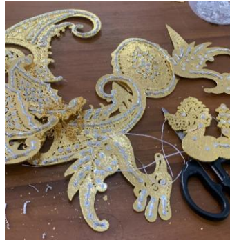
Gambar 10. Proses ngertepi

Proses pemasangan kertep dan manik-manik atau ngertepi . Pada tatahan patran menggunakan gim dan kertep , kemudian pada tatahan mas-masan menggunakan manik-manik dan kertep .