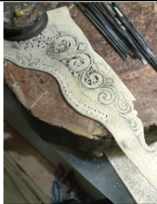
Gambar 4. Sebelum mbedahi