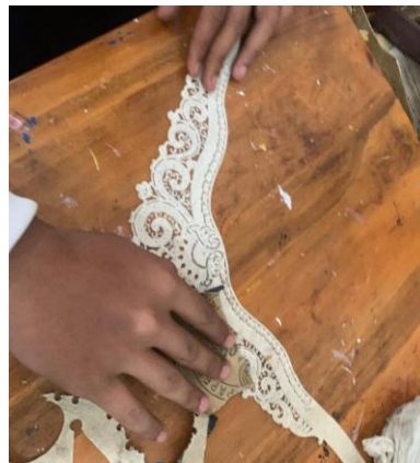
Gambar 6. Proses Amplas

Proses ini untuk merapikan tatahan supaya halus dan juga meratakan permukaan supaya nanti pada waktu proses sungging akan lebih mudah dalam prosesnya.