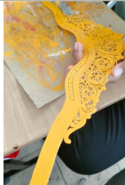
Gambar 7. Pewarnaan dasar

Untuk proses selanjutnya mrodo emas, sebelum diprada melapisi gebingan dengan cat minyak, ditunggu sebentar sampai tidak terlalu lengket dijari kemudian dilapisi dengan prada buku.