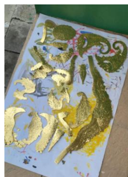
Gambar 9. Proses clear

Proses Selanjutnya ngedusi atau pemberian lapisan clear (mowilex clear yang ditambah dengan air) pada bagian yang sudah di prada.