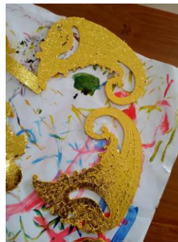
Gambar 8. Proses prada

Untuk proses selanjutnya mrodo emas, sebelum diprada melapisi gebingan dengan cat minyak, ditunggu sebentar sampai tidak terlalu lengket dijari kemudian dilapisi dengan prada buku.