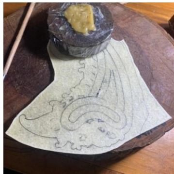
Gambar 3. Hasil coretan

Proses ini merupakan tahapan awal dari serangkaian proses dalam menatah. Nyorek merupakan pembuatan pola atau menggambar pola, jika pola aksesoris tari masih dikertas diperlukan kulit perkamen yang bening supaya mudah untuk mengcopy pola tersebut. Cara nyorek meletakkan pola dikertas dibawah kulit, kemudian gambar tersebut dicopy pada kulit. Bagian-bagian terpenting dalam pola juga dicopy untuk memudahkan pada waktu ditatah.