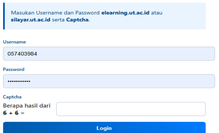
Gambar 3. Tampilan halaman login e-modul PBSI-UT menggunakan NIM dan password

Dengan demikian, pengembangan sistem akses cepat bahan ajar digital e-modul PBSI-UT berbasis QR Code yang terintegrasi dengan mekanisme login menggunakan NIM dan password menunjukkan bahwa produk yang dihasilkan tidak hanya memudahkan akses bahan ajar, tetapi juga tetap memperhatikan aspek keamanan, keterkendalian, dan keberlanjutan penggunaan dalam konteks pembelajaran jarak jauh.