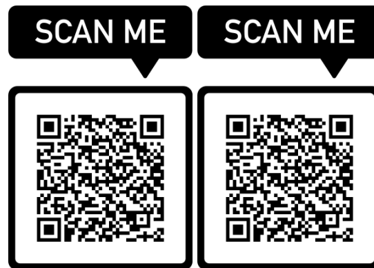
Gambar 1. QR Code sistem akses cepat bahan ajar digital e-modul PBSI-UT

Produk yang dihasilkan dalam penelitian ini berupa QR Code sistem akses cepat bahan ajar digital e-modul PBSI-UT. QR Code yang dikembangkan bersifat statis dan berisi tautan langsung menuju halaman e-modul PBSI-UT. QR Code ini dirancang untuk ditempatkan pada media cetak maupun digital, seperti poster informasi, buku panduan mahasiswa, serta media komunikasi daring. Pengguna cukup melakukan pemindaian satu kali untuk mengakses bahan ajar digital sesuai mata kuliah yang ditempuh. QR Code yang dikembangkan berisi tautan langsung menuju halaman e-modul dan telah diuji secara teknis untuk memastikan keterbacaan serta keterhubungan tautan. Hasil pengujian menunjukkan bahwa QR Code dapat dipindai dengan baik menggunakan berbagai perangkat gawai dan berhasil mengarahkan pengguna ke bahan ajar digital yang dituju. Dengan bentuk QR Code statis, tautan akses dapat digunakan secara berkelanjutan tanpa memerlukan pembaruan kode selama alamat bahan ajar digital tetap tersedia.