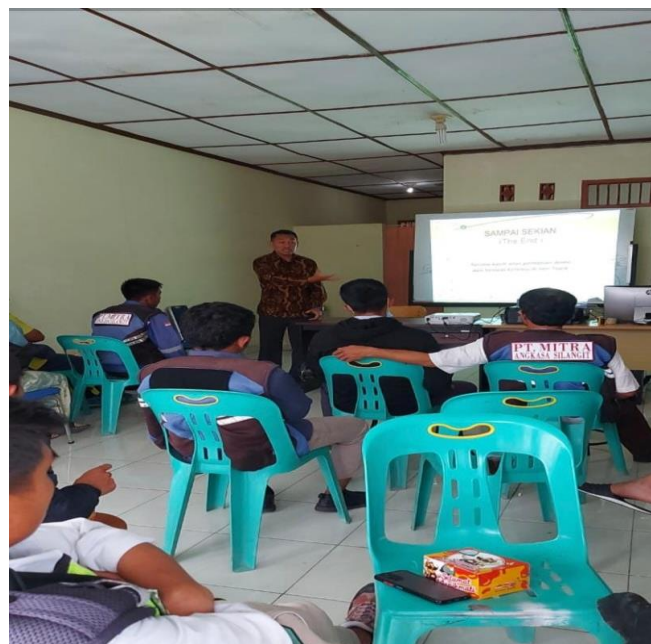
Gambar 2. Penyuluhan Masyarakat