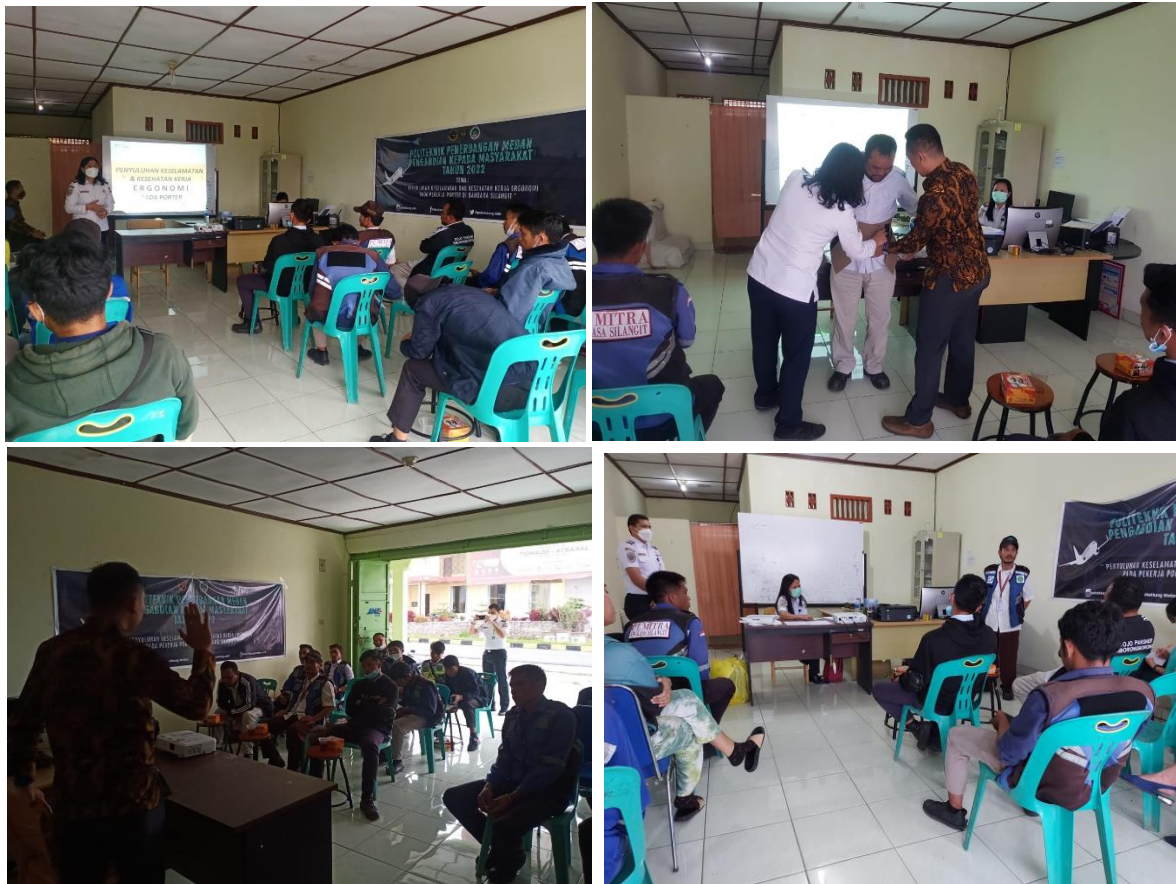
Gambar 1. Pengabdian Masyarakat pada pekerja porter