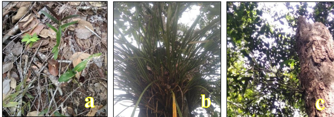
Gambar 1. Habitat Anggrek di Kawasan Rawan Gangguan SM. Bukit Rimbang dan Bukit Baling a. habitat anggrek terrestrial b dan c. Habitat anggrek epifit