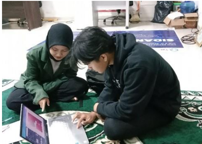
Gambar 4. Pemateri memberikan arahan pada peserta lomba

melanjutkan materi dan pemateri membantu memberikan arahan dan masukan terkait pamflet yang dibuat utk lomba tersebut.