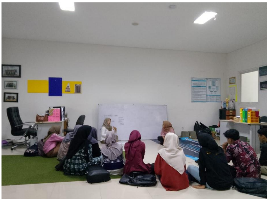
Gambar 1. Pemaparan materi dan sharing session

dalam berwirausaha di bidang desain grafis. Pelatihan desain grafis juga dapat mempermudah mahasiswa beradaptasi dengan lingkungan kerja untuk mempersiapkan mahasiswa menjadi tenaga kerja yang terampil. Selain itu, pelatihan desain grafis juga dapat membantu pemuda merasakan proses pembuatan desain yang dijalani dari awal dan memudahkan dalam bertukar informasi, membuat informasi menjadi lebih menarik dan lebih nyaman secara visual.