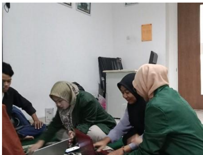
Gambar 3. Pendampingan peserta dalam proses mendesain

Pada sesi ketiga yaitu sesi praktik dimana pada setiap pertemuannya kami selalu memberikan waktu untuk melakukan praktik mendesain dengan memberikan tema tertentu yang harus peserta buat. Sehingga kami mengetahui peningkatan kemampuan dalam mendesain setiap peserta di setiap pertemuannya. Tujuan pelatihan desain grafis pada pertemuan pertama ini adalah memberikan pemahaman kepada peserta yang mengikuti kegiatan pelatihan desain grafis tentang apa itu desain grafis secara mendasar agar ketika mereka sudah melakukan praktik atau menerapkannya pada salah satu platform desain bisa memahami apa itu desain dengan baik.