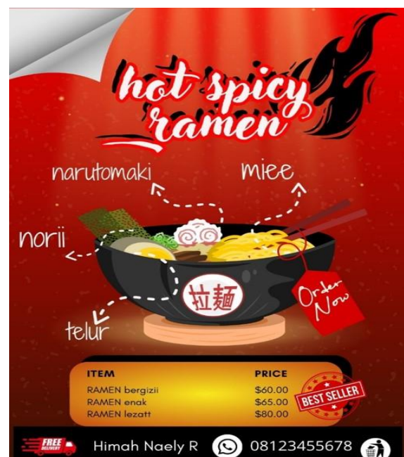
Gambar 5 dan 6. Hasil desain peserta pelatihan desain grafis