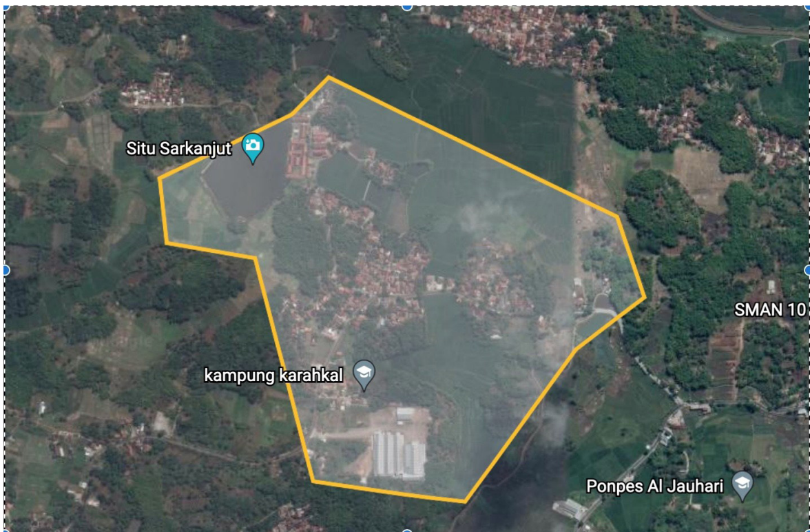
Gambar 1 Peta Sarkanjut

tatanan kehidupan masyarakat yang tertata dan teratur, pola hidup ini disepakati oleh masyarakat tertentu sebagai pegangan hidup dan diwariskan kepada generasi selanjutnya. Hal ini disampaikan Sumardjo dalam pendapatnya yaitu "Budaya adalah cara berpikir kolektif yang merupakan segi operasional suatu proses cara kerja dan bertindak yang dinilai baik, benar, bagus, pantas dan seharusnya menurut pandangan masyarakat budaya hadir dalam benda-benda budayanya yang dihasilkan dengan dasar cara berpikir tertentu" (Sumardjo, 2015: 3).