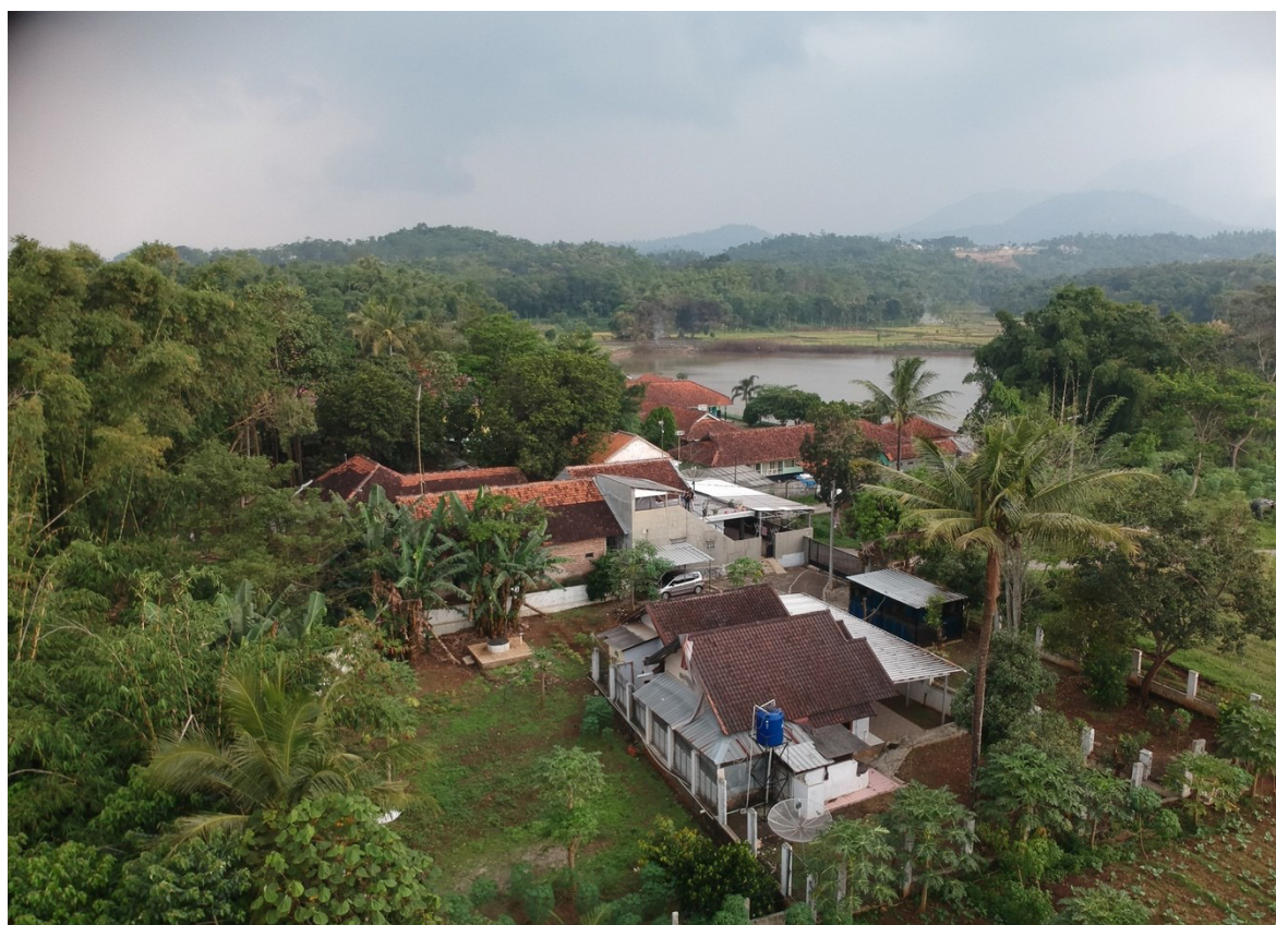
Gambar 3 Kampung Sarkanjut (Dokumentasi: Hadianto, 2021)

nilai-nilai khusus yang ingin disampaikan, pesan tentang nilai-nilai kesundaan yang berkaitan dengan hidup manusia Sunda di dunia ini. Dalam tradisi Sunda, tradisi lisan sangat berperan penting terhadap perkembangan peradaban Sunda itu sendiri, hal ini dikarenakan dalam kebudayaan Sunda ditemukan banyak artefak budaya yang tidak berbentuk. Hal ini selaras dengan pendapat Sumardjo menyatakan bahwa “kebudayaan Sunda pada dasarnya intangible , sebab terdapat di dalam benak masyarakatnya, namun tetap bisa dikenali dari hasil-hasil tangible berbentuk artefak yang dihasilkan oleh warga Sunda” (Sumardjo, 2015: 17).